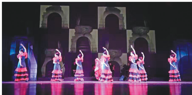
舞剧《剧院魅影》剧照

本报讯 记者王臻青报道 11月24日晚,古巴舞蹈家在辽宁大剧院演出舞剧《剧院魅影》,拉开“辽宁大剧院第三届国际演出季”帷幕。记者从辽宁省文化演艺集团(省公共文化服务中心)了解到,省演艺事业发展中心充分发挥促进国内外文化演艺资源交流的职能,引进国内外精品剧目,在辽宁大剧院举办了国际演出季活动。从2019年11月下旬至2020年1月,国内以及古巴、俄罗斯、奥地利等国家的知名艺术团队将应邀来到辽宁大剧院,为辽沈观众带来舞蹈、音乐会、越剧等7场高品质的文艺演出,以丰富多彩的艺术盛宴迎接新年的到来。演出季还推出了惠民票,以便更多观众走进剧场。