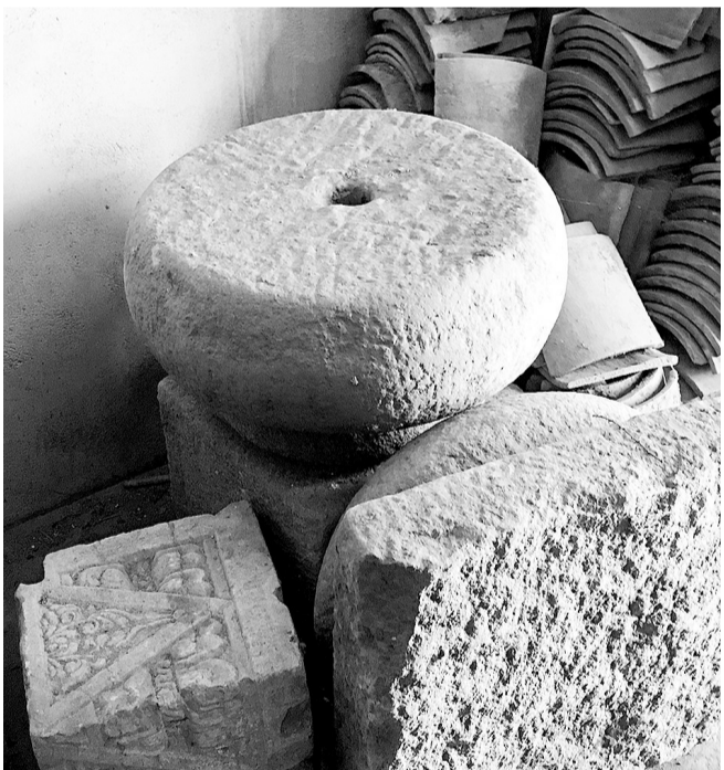
安乐堂遗址保留下来的建筑构件。