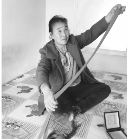
肇启军家世代相传的红带子。