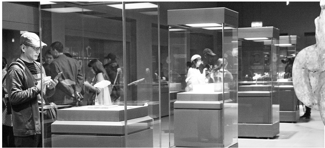
“又见红山”精品文物展现场。