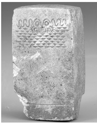
石雕神人像(资料片)