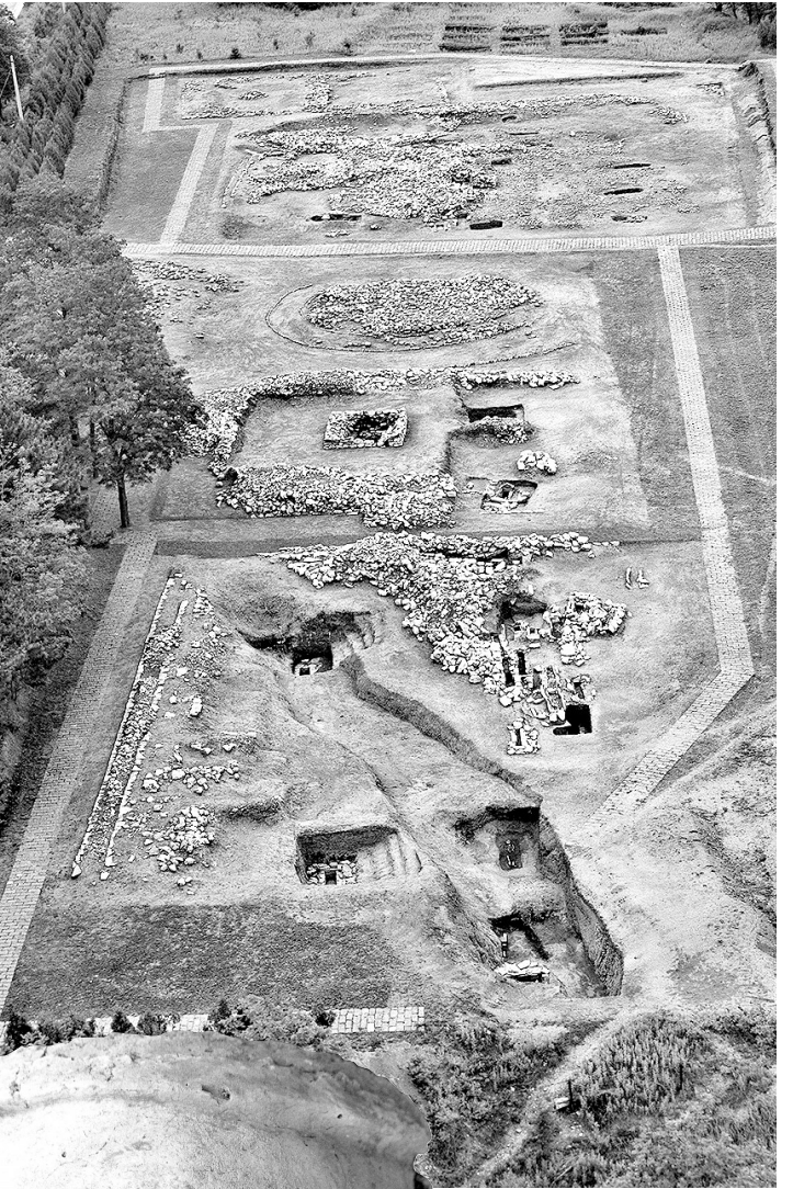
牛河梁第二地点全景(资料片)

据此,郭大顺分析,红山文化墓葬规模及随葬品的数量、质量是反映人与人等级差别最主要的标准,该文化不葬或少葬与生产、生活有关的石器和陶器,说明当时在表达人与人之间的等级地位