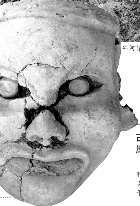
红山女神像(资料片)