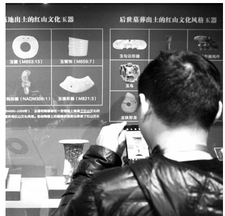
观众观看展品。

令人激动的发现只是刚刚开始。此后,牛河梁遗址不但发现了迄今所知规模最大的红山文化晚期中心性祭祀遗址,而且出土了一批具有明确层位关系的红山文化玉器。