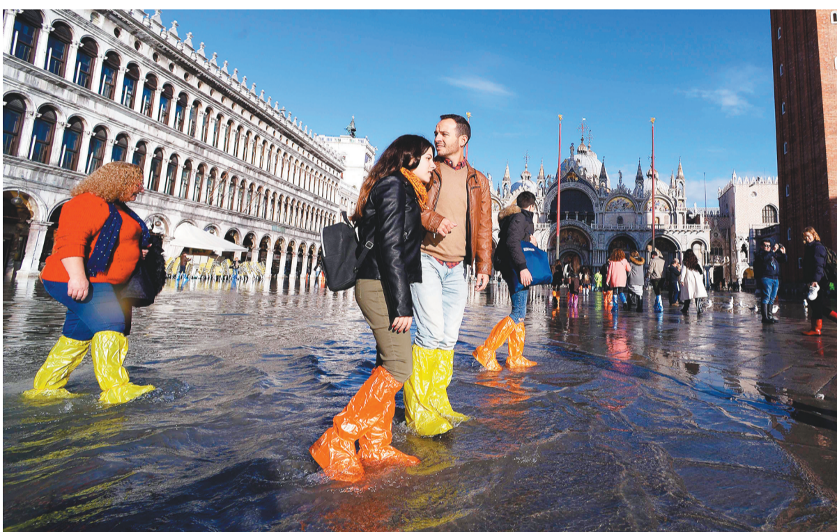
11月14日,在意大利威尼斯,人们在圣马可广场蹚水行走。意大利政府14日宣布,正遭受洪灾侵袭的意大利古城威尼斯进入紧急状态。本周以来,受极端天气影响,威尼斯遭遇严重洪灾。威尼斯海浪预测与监控中心公布的数据显示,12日威尼斯最高水位曾达到1.87米,这是自1966年以来该地区出现过的最高值。此后水位有所回落,预计15日峰值还将达到1.45米。截至目前,极端天气已造成2人死亡、多人受伤。