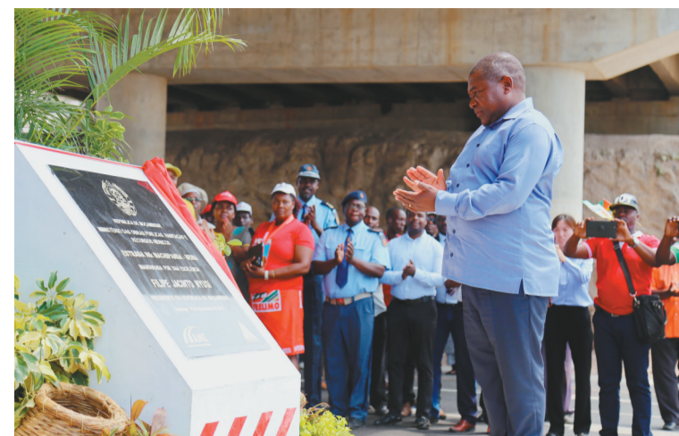
11月14日,莫桑比克总统纽西在中部马尼卡省举行的N6公路改扩建项目竣工典礼上为工程竣工纪念碑揭幕。由中企融资和承建的莫桑比克交通干线N6公路改扩建项目14日正式竣工通车,莫总统纽西等出席竣工庆典。