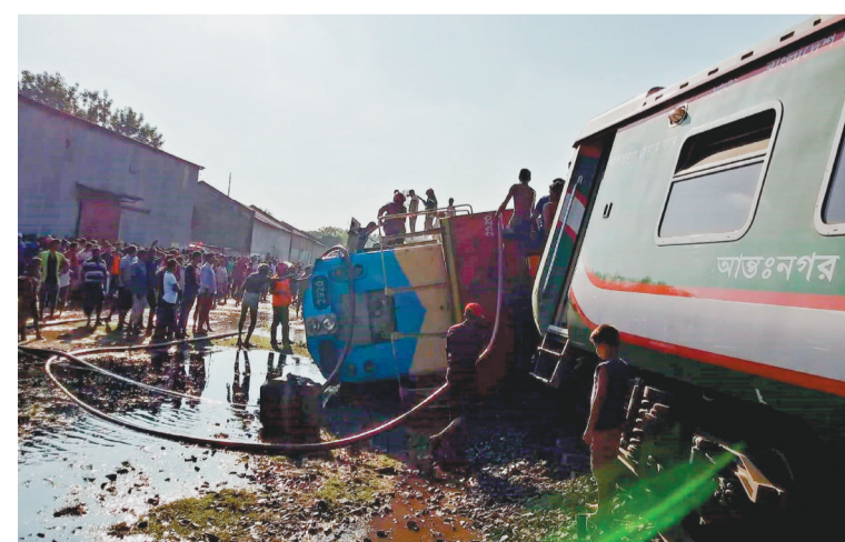
图为在孟加拉国锡拉杰甘杰,消防人员在火车脱轨事故现场工作。14日,孟加拉国的一列火车行驶至锡拉杰甘杰地区的乌拉巴拉火车站时发生脱轨,部分车厢起火。事故造成包括首都达卡在内的部分地区火车运行一度因此被中断。