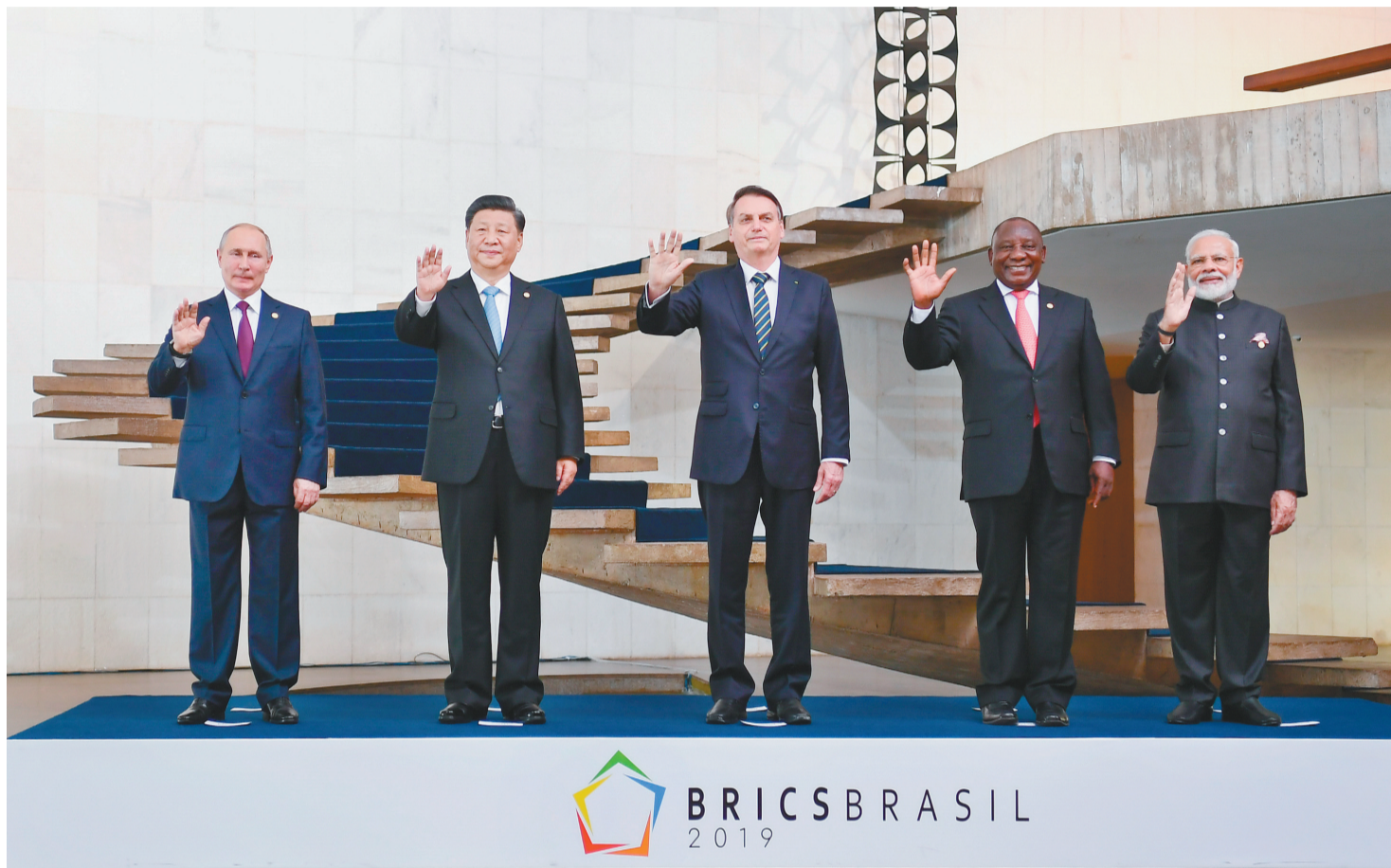
当地时间11月14日,金砖国家领导人第十一次会晤在巴西首都巴西利亚举行。巴西总统博索纳罗主持会晤。中国国家主席习近平、俄罗斯总统普京、印度总理莫迪、南非总统拉马福萨出席。这是五国领导人合影。

新华社巴西利亚11月14日电(记者陈贲 霍小光 杨依军)当地时间11月14日,金砖国家领导人第十一次会晤在巴西首都巴西利亚举行。巴西总统博索纳罗主持会晤。中国国家主席习近平、俄罗斯总统普京、印度总理莫迪、南非总统拉马福萨出席。五国领导人围绕“经济增长打造创新未来”主题,就金砖国家合作及共同关心的重大国际问题深入交换意见,达成广泛共识。