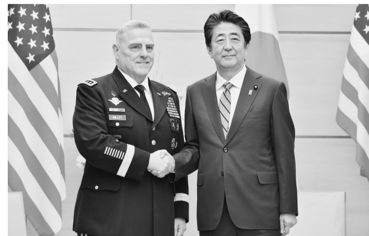
11月12日,在日本东京,日本首相安倍晋三(右)与到访的美军参谋长联席会议主席马克·米利握手。日本首相安倍晋三12日在首相官邸与到访的美军参谋长联席会议主席马克·米利举行会谈,双方就日韩《军事情报保护协定》续期等问题进行了磋商。