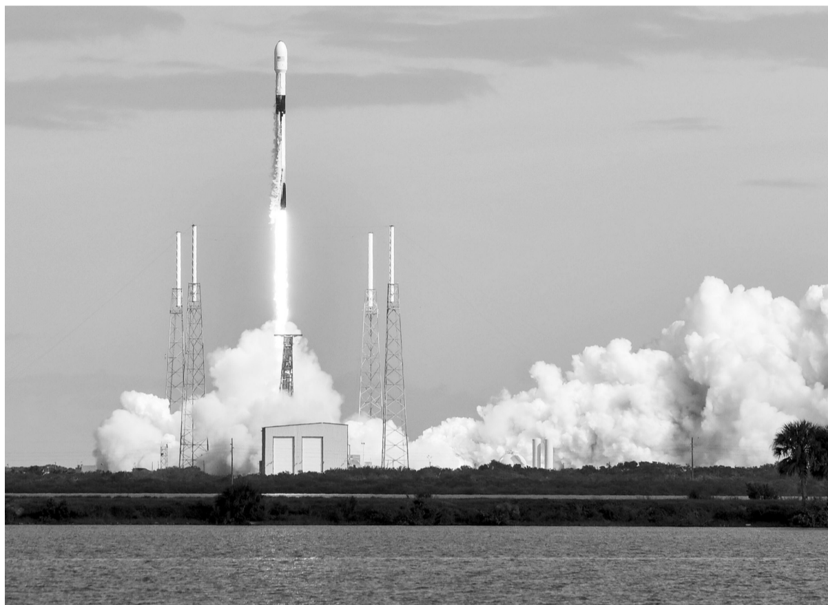
上图:11月11日,在美国佛罗里达州卡纳维拉尔角空军基地,“猎鹰9”火箭点火升空。 下图:11月11日,在美国佛罗里达州,两名行人观看“猎鹰9”火箭从卡纳维拉尔角空军基地点火升空。 美国太空探索技术公司11日用一枚“猎鹰9”火箭将第二批60颗“星链”卫星送入太空,继续搭建其全球卫星互联网。