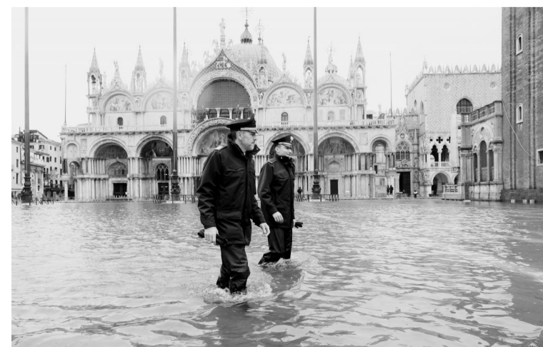
11月12日,在意大利威尼斯,两名警察在圣马可广场涉水巡逻。意大利北部城市威尼斯迎来雨季,水位上升淹没部分地区。据当地气象部门预测,威尼斯水位将持续上升。