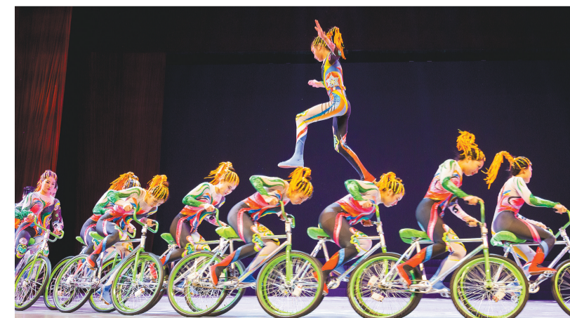
《炫彩车技》演出剧照。

以往车型杂技的车技都是单人骑,一个人来完成各种技巧。在演出现场,演员们的蹦肩、跑背、双层排楼的动作技巧震惊了评委,被认为