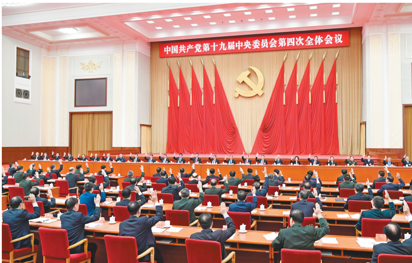
中国共产党第十九届中央委员会第四次全体会议,于2019年10月28日至31日在北京举行。中央政治局主持会议。新华社记者 申宏 摄

新华社北京10月31日电 中国共产党第十九届中央委员会第四次全体会议公报(2019年10月31日中国共产党第十九届中央委员会第四次全体会议通过) 中国共产党第十九届中央委员会第四次全体会议,于2019年10月28日至31日在北京举行。 出席这次全会的有,中央委员202人,候补中央委员169人。中央纪律检查委员会常务委员会委员和有关方面负责同志列席会议。党的十九大代表中的部分基层同志