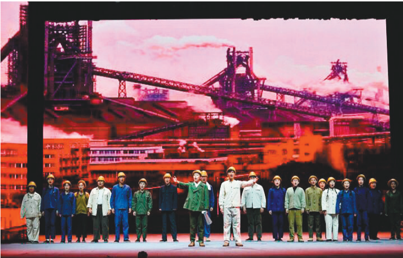
原创音乐剧《钢铁是怎样炼成的》剧照。