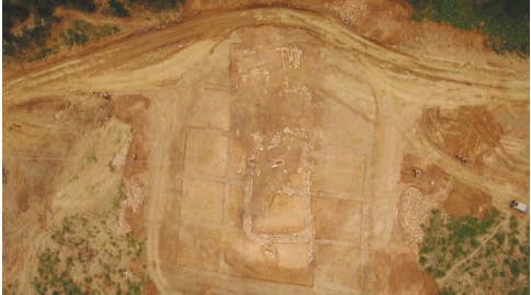
建平东山岗墓地全景图