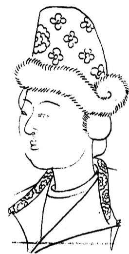
戴貂帽少女 韦项墓