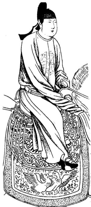
推论第一骑为女扮男装的虢国夫人