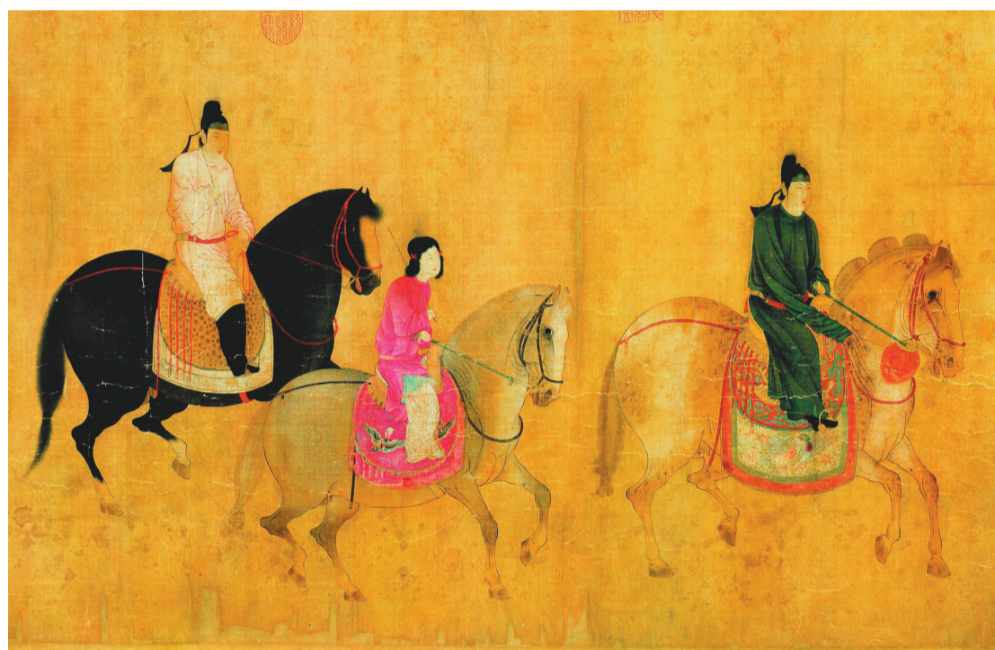
《虢国夫人游春图》局部