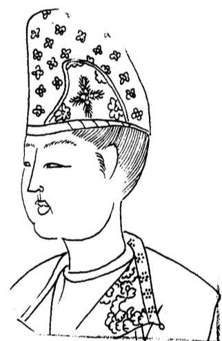
戴浑脱帽少女 韦项墓