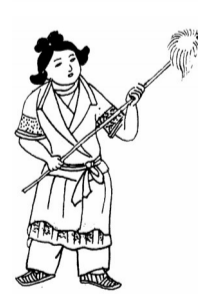
莫高窟147窟 唐壁画女孩