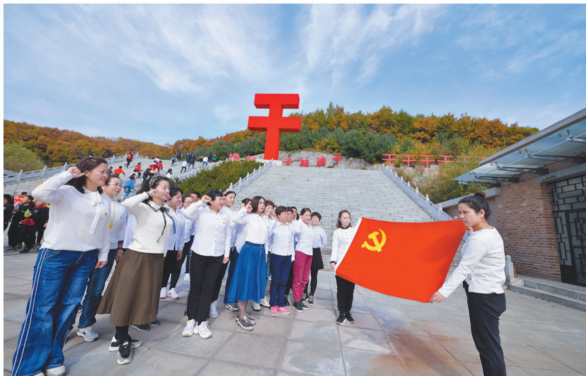
丹东市元宝区开展主题教育党日活动。(资料片)

目前,全市已解决突出问题1533个,建立管理制度10项,制定出台规范17项,办理民生实事851件,经济社会各项事业稳步发展,鲜艳的党旗在鸭绿江畔迎风飘扬,人民群众幸福感、获得感不断提高。