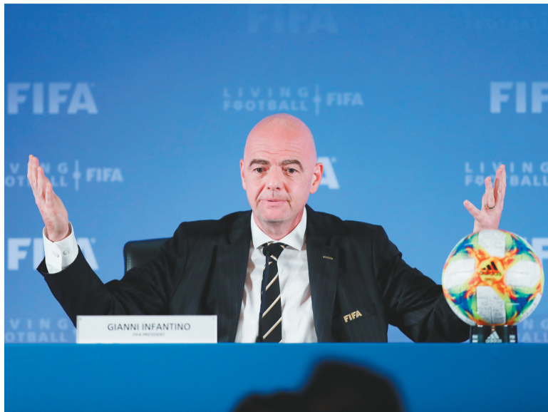
10月24日,国际足联主席因凡蒂诺在上海举行的国际足联理事会会后新闻发布会上回答记者提问。

中国是国际足联理事会唯一推荐举办2021年世俱杯并纳入考虑范围的国家。因凡蒂诺在接受采访时说:“我们联系了亚洲好几个国家的足协,中国足协的竞标方案是最优秀的,所以一致决定在中国举办。”根据媒体此前的报道,2021年世俱杯的举办时间为2021年6月17日至7月4日,奖金将达到1.2亿美元,每支参赛俱乐部均能获得2000万美元的奖金。届时,将会有6至8座城市成为世俱杯赛场,24支参赛球队将分为8个小组进行单循环比赛,每个小组的第一名出线进入淘汰赛,直至决出冠军。