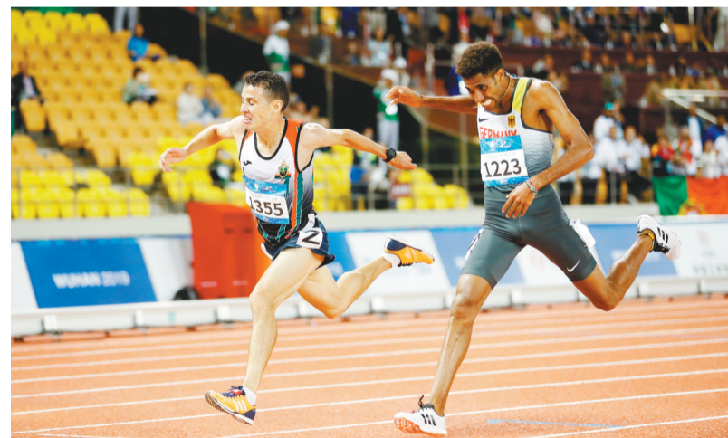
10月23日,在武汉举行的第七届世界军人运动会田径项目男子10000米决赛中,摩洛哥选手埃尔-阿拉比以28分44秒25的成绩获得冠军。图为冠军摩洛哥选手埃尔-阿拉比(左)和德国选手彼得罗冲过终点。