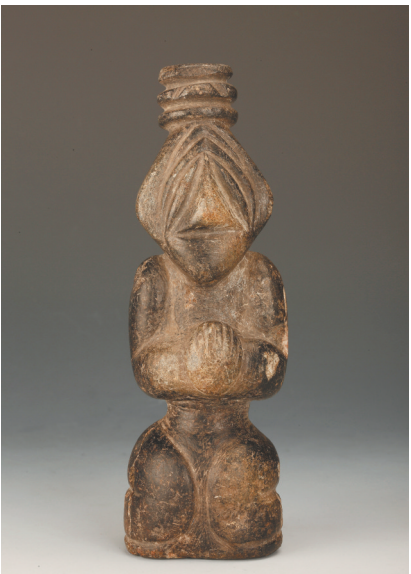
石雕人像 新石器时代红山文化 内蒙古赤峰巴林右旗巴彥汉苏木那斯台遗址出土 巴林右旗博物馆藏 泛灰石质。头戴三层相轮高冠,面呈菱形,三角凸棱形眼,直鼻三角形突起,阔嘴,双手捧于胸前,呈双膝跪坐施法状。