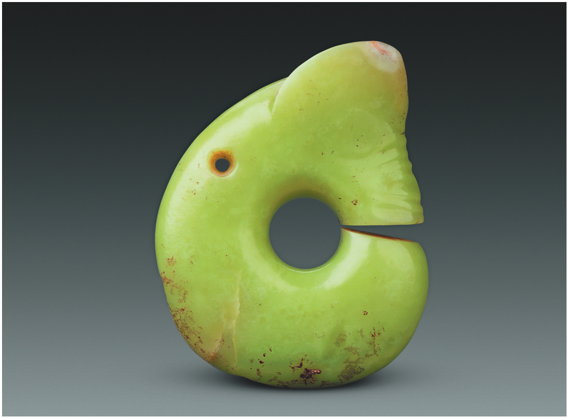
玉玦形龙 新石器时代红山文化 辽宁朝阳牛河梁遗址出土 辽宁省文物考古研究院藏

红山文化东山嘴、草帽山和牛河梁的祭坛都位于遗址(群)南部,牛河梁、半拉山的庙宇遗址都在北部,构成北庙南坛的组合和布局。商代以后直到明清时期,都有祭祀建筑位于城市南部的