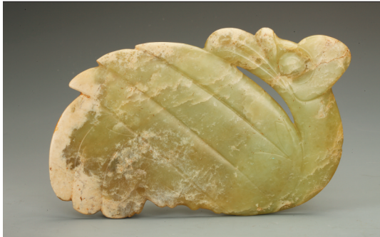
玉凤 新石器时代红山文化 辽宁朝阳牛河梁遗址出土 辽宁省文物考古研究院藏 淡绿色玉,有小开片。凤卧姿回首,高冠、曲颈、圆睛、疣鼻,扁喙呈弯钩状,喙前端埋于翅膀内。翅羽作三分上扬,尾羽作三分向下,以阴线浅刻羽根下短短的绒羽。凤身上的雕刻线条虽简,却层次井然,颇富立体感。背面光素无纹,有四对隧孔,均为竖穿,两两相对。