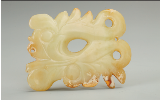
玉龙凤佩 新石器时代红山文化 辽宁朝阳牛河梁遗址出土 辽宁省文物考古研究院藏 黄绿色,局部见少量黄褐色瑕疵,应为原玉料的皮壳部分所遗。正面以减地阳纹与较粗的阴线雕出一龙一凤,都以头部雕刻为主,身体简化。龙吻部前凸,长舌圆睛,凤首高冠圆睛,喙部上扬。二者依附交缠,生动传神,设计极具巧思。背四,附有四组对钻斜孔,有砣具定位痕。