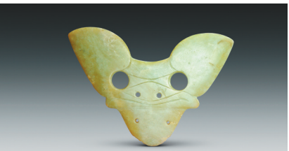
玉兽面牌饰 新石器时代红山文化 辽宁朝阳牛河梁遗址出土 辽宁省文物考古研究院藏 青绿色玉,有一道裂纹。器体扁薄平整,雕成剪影式的兽首形象。双耳大而竖起,以大圆孔表现双目,小圆孔表示鼻孔。吻部宽大,口部与下额之间起棱相隔,下额部分收窄,且有对钻两小孔,有似为插嵌使用痕迹。造型富艺术美感。

玉质通体白化,呈乳白色。器呈扁长条形。长方形脸,面部以浅线条勾勒出眼眉,蒜头鼻、厚唇、大耳,双耳耳垂各钻一孔。头戴方格纹尖顶圆冠,双手五指张开置于胸前,腕上阴刻八道横纹以示手镯;束腰并饰斜条纹宽带;下肢圆润肥厚,腿短,似坐势,双脚并拢,脚趾清晰。人物背面平素,齐耳根饰一条横纹,背部钻一牛鼻式穿孔。