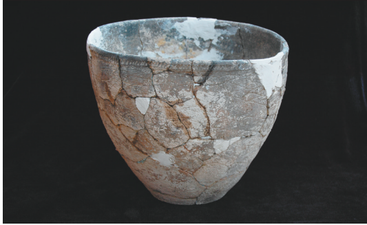
“之”字纹陶筒形罐 新石器时代红山文化 内蒙古赤峰魏家窝铺遗址出土 内蒙古自治区文物考古研究所藏 夹粗砂灰褐陶。圆唇,斜弧腹。口沿外饰一周附加堆纹,其上饰斜向刻齿纹。腹部饰稀疏的横压竖排直线“之”字纹,纹线长短相等,纹距不均,腹部近底处素面。平底,底部印有席纹。