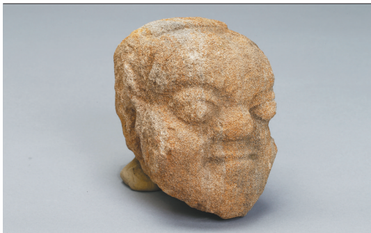
石雕人头像 新石器时代红山文化 辽宁朝阳半拉山墓地出土 辽宁省文物考古研究院藏 黄褐色砂岩质,表面风化,有一层土沁。为一整块石料雕刻而成。雕刻头部宽额头、高颧骨、矮鼻梁、深眼窝,双目圆瞪,双唇紧闭,面部轮廓清晰,神态自然。发髻位于头顶中后部,呈椭圆形,后枕部不见发髻。形象生动,雕刻技法高超。

墨绿色玉,有瑕疵、裂纹和沁色。身体硕大,蜷曲如“C”形。头部大致与身体等宽。阴刻梭形大眼,吻部前伸,前端平齐,有两个捏钻痕表示鼻孔。颌上及颌下有阴刻的网格纹,颈背部有飘逸的长鬃,背部中央有一小孔,可供穿绳系挂。造型简洁。