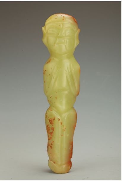
玉人 新石器时代红山文化 辽宁朝阳牛河梁遗址出土 辽宁省文物考古研究院藏 黄绿色透闪石籽料,背面有大面积深浅不一的铁锈红瑕疵。玉人为整身形象,立姿,形体为圆角的三面体,有正面、背面之分,背面光素无纹饰。人体正面半圆雕,头部方圆,双眼半合,嘴巴半张,额间凹陷,表情呈痴迷状态,双臂曲肘,双手立于胸前,双腿并足而立,呈站立祈祷状。颈的两侧及后面对钻有三通孔。可穿绳系挂。