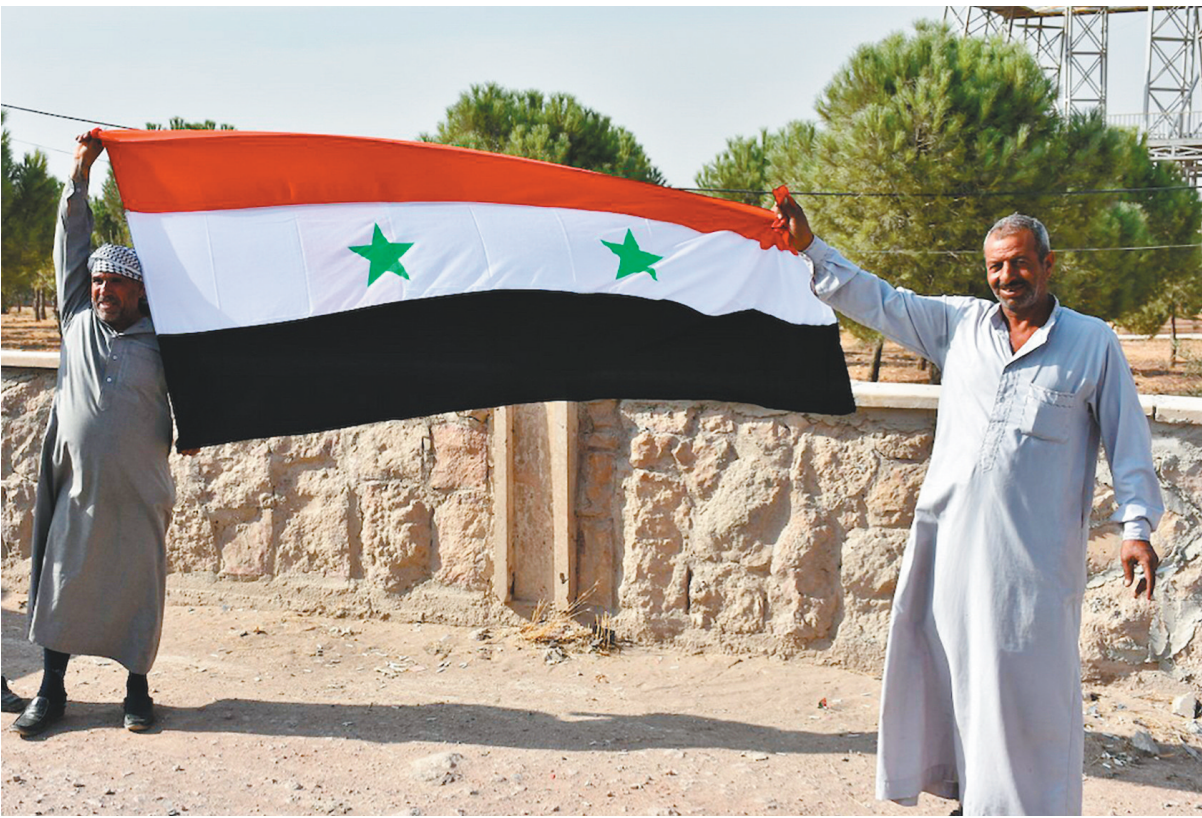
10月15日，在叙利亚北部曼比季，叙利亚人手举国旗欢迎叙利亚政府军进驻。据叙利亚通讯社报道，叙政府军14日进驻此前由叙库尔德武装主导的“叙利亚民主军”控制的叙北部重镇曼比季。