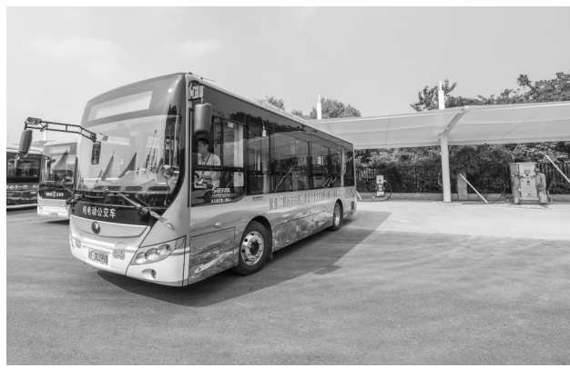
左图:空中俯瞰长兴县画溪公交枢纽站(10月10日无人机拍摄)。右图:10月10日,一辆电动公交车从长兴县画溪公交枢纽站内出发。

截至2019年10月初,浙江省长兴县内的电动公交车已全部配备到位,各个公交站点的新增充电桩进入最后调试验收阶段。所有公交线路上的电动公交车将取代原有的汽油、柴油车辆,实现城乡电动公交全覆盖,减少环境污染,服务绿色出行。