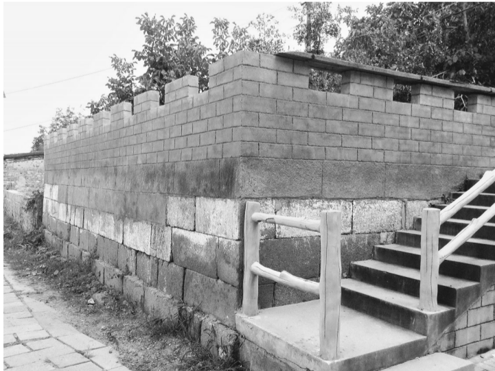
修复后的点将台遗迹。