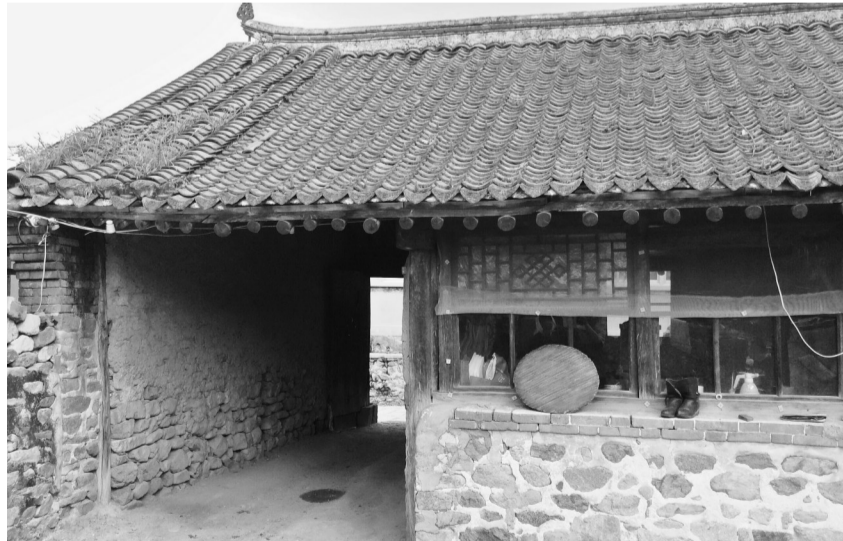
传统民居中的门房院内视图。