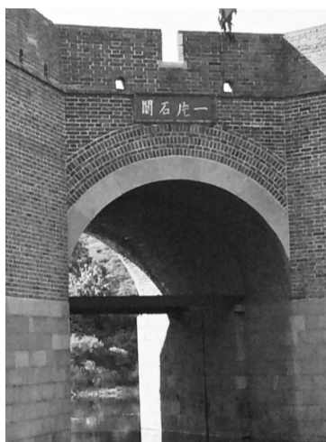
九门口长城上的一片石关门额。