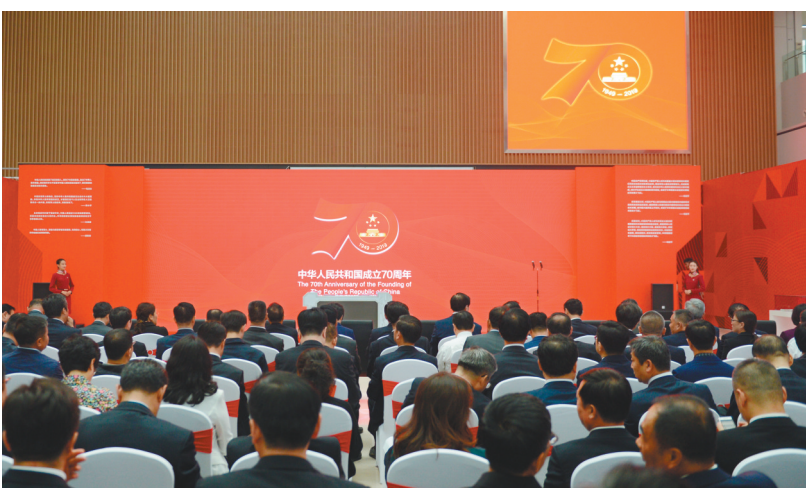
图为辽宁省庆祝中华人民共和国成立70周年成就展开幕式现场。

本报讯 记者杨忠厚报道 70年砥砺前行,70年壮丽辉煌。9月29日,辽宁省庆祝中华人民共和国成立70周年成就展开幕式在省图书馆举行。省委书记、省人大常委会主任陈求发,省委副书记、省长唐一军出席开幕式、为成就展揭幕并观看展览。省政协党组书记、主席夏德仁出席开幕式并观看展览。举办庆祝中华人民共和国成立70周年成就展,旨在全面展示、全景呈现70年来,特别是党的十八大以来,在以习近平同志为核心的党中央坚强领导下,辽宁经历的伟大变革、走过的非凡历程、取得的辉煌成就、积累的宝贵经验,激励广大干部群众进一步树牢“四个意识”、坚定“四个自信”、做到“两个维护”,加快推进全