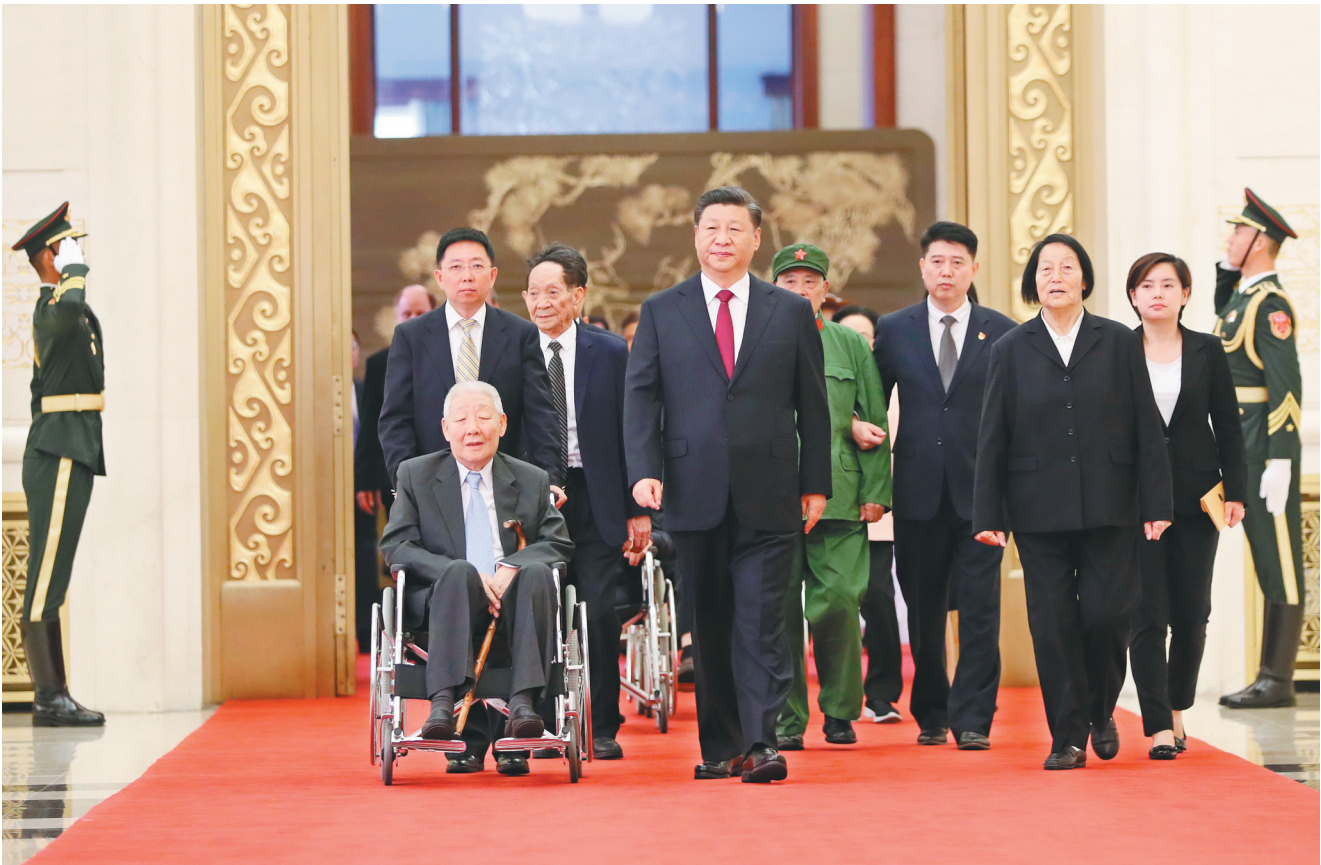
9月29日,中华人民共和国国家勋章和国家荣誉称号颁授仪式在北京隆重举行。中共中央总书记、国家主席、中央军委主席习近平同国家勋章和国家荣誉称号获得者一同步入会场。

新华社北京9月29日电 (记者邹伟 黄玥) 中华人民共和国国家勋章和国家荣誉称号颁授仪式29日上午在北京人民大会堂金色大厅隆重举行。中共中央总书记、国家主席、中央军委主席习近平向国家勋章和国家荣誉称号获得者颁授勋章奖章并发表重要讲话。习近平强调,崇尚英雄才会产生英雄,争做英雄才能英雄辈出。英雄模范们用行动再次证明,伟大出自平凡,平凡造就伟大。只要有坚定的理想信念、不懈的奋斗精神,脚踏实地地把每件平