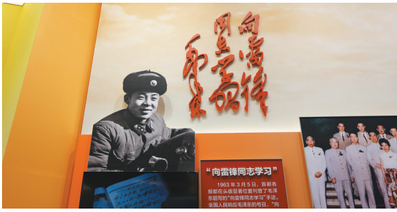
“雷锋精神”激励一代又一代人。