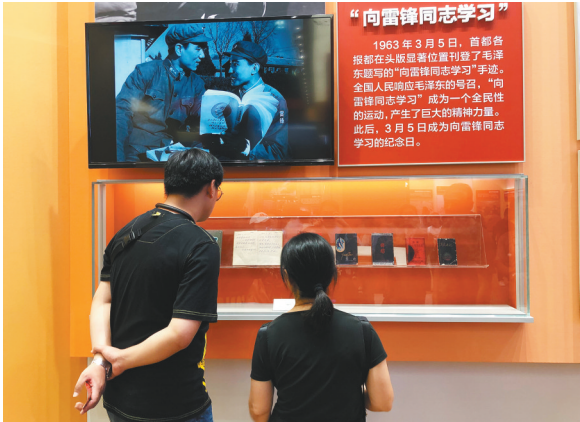
参观群众在观看“雷锋日记”。