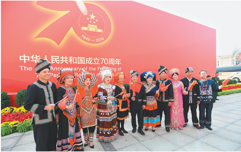
参展的各族群众合影留念,共庆新中国七十华诞。