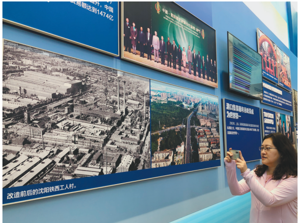
一张张图片和文字,见证并记录着辽宁“改革当先”的豪情。