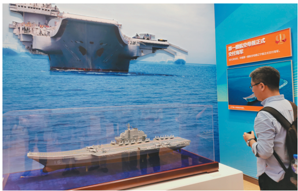
首艘国产航母——“辽宁号”不仅是辽宁更是全国的骄傲。