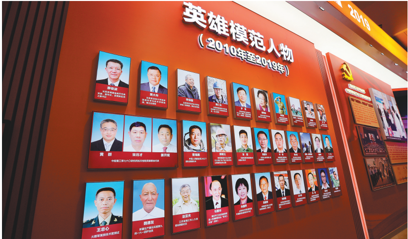
孟泰、雷锋、罗阳、郭明义……一个个熟悉的名字构成蔚为壮观的辽宁英模群像。