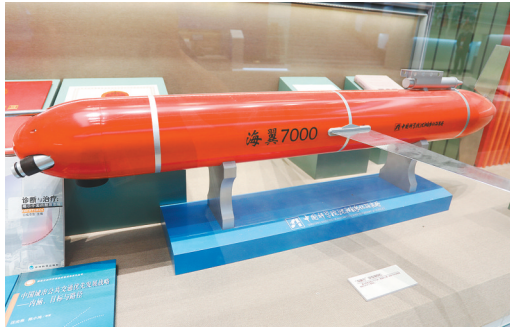
海翼7000深海滑翔机。