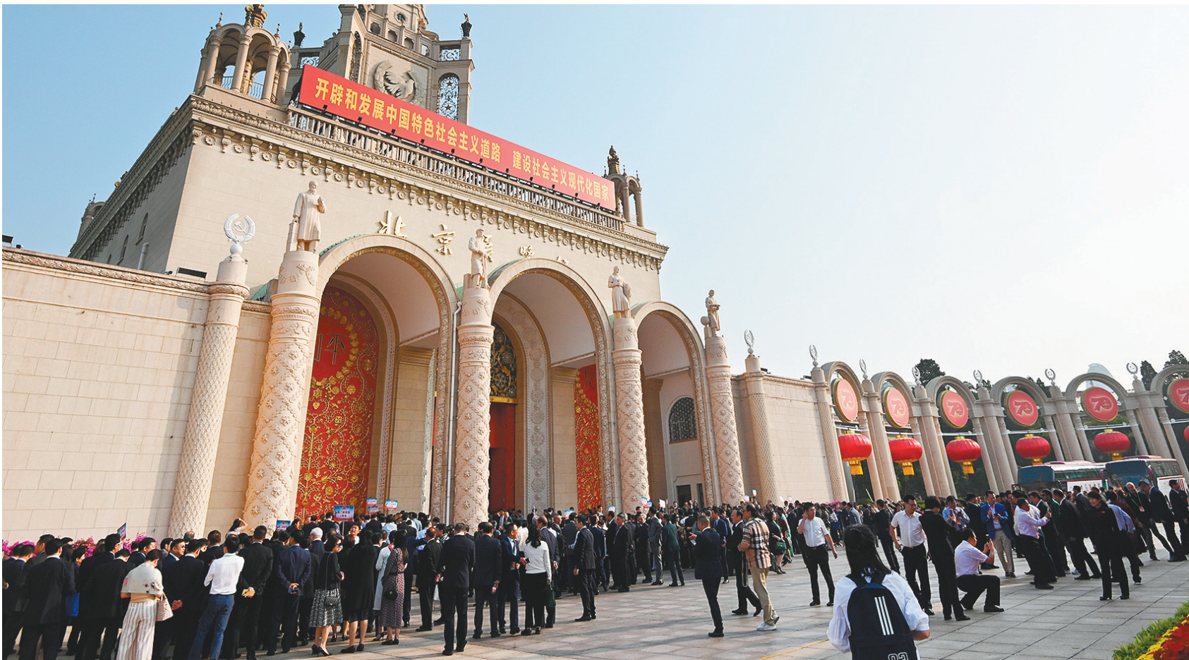
大型成就展开展后,吸引了众多参观者到场。

打造对外开放新前沿,辽宁,正以崭新的面貌重振雄风,奋力谱写全面振兴、全方位振兴的辉煌篇章。