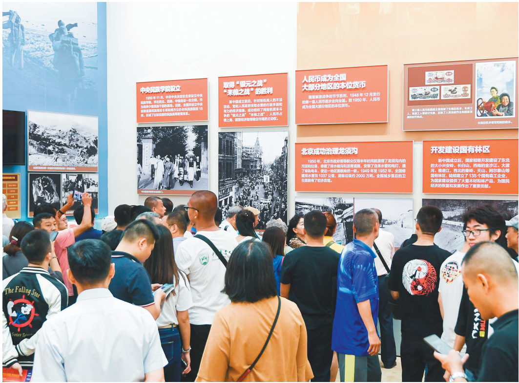
成就展上的介绍,让观众感受峥嵘岁月,辉煌的历程。