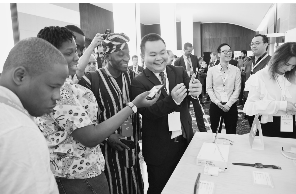
9月23日,在突尼斯举办的“华为北非创新日”论坛活动上,华为员工向来自贝宁的客户介绍华为产品。中国华为公司23日在突尼斯举办“华为北非创新日”论坛,来自突尼斯以及其他阿拉伯和非洲国家的300多名官员、专家和学者参加论坛。