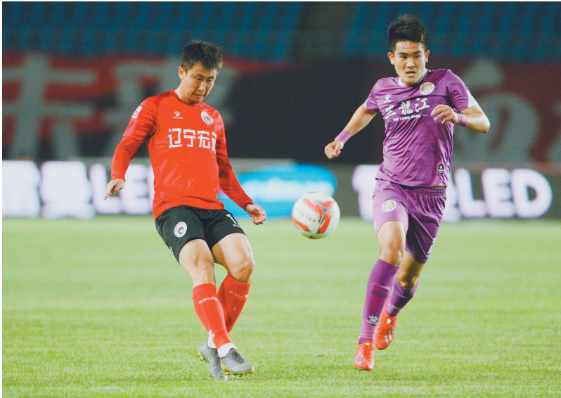
接下来的比赛,辽宁队将减少对外援的使用。

上周末,沈阳城市队在主场战胜宁夏火凤凰队后,成为第一支晋级下赛季中甲联赛的乙级球队。中乙联赛分为南北两区,共有32支球队,按照规则,分区冠军直接获得中甲联赛参赛资格,沈阳城市队在联赛还剩1轮的情况下领先第二名4分,以北区冠军的身份冲甲成功。中乙南区冠军的争夺目前进入白热化,成都兴城队和苏州东吴队同积64分,成都兴城队以净胜球优势排名首位,最后一轮比赛,成都兴城队客场挑战排名垫底的云南昆陆队,只要击败对手就可以冲甲成功。