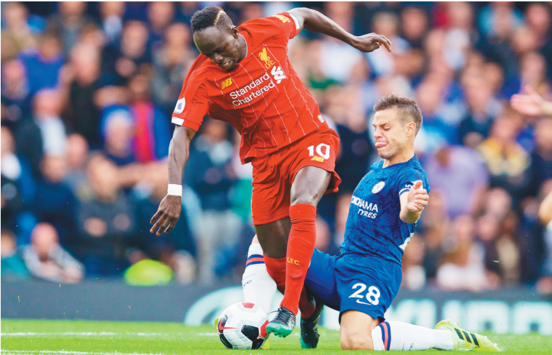
9月22日,在本赛季英格兰足球超级联赛第六轮比赛中,利物浦队客场以2:1战胜切尔西队,以全胜战绩领跑英超。图为利物浦队球员马内(左)与切尔西队球员阿斯皮利奎塔拼抢。