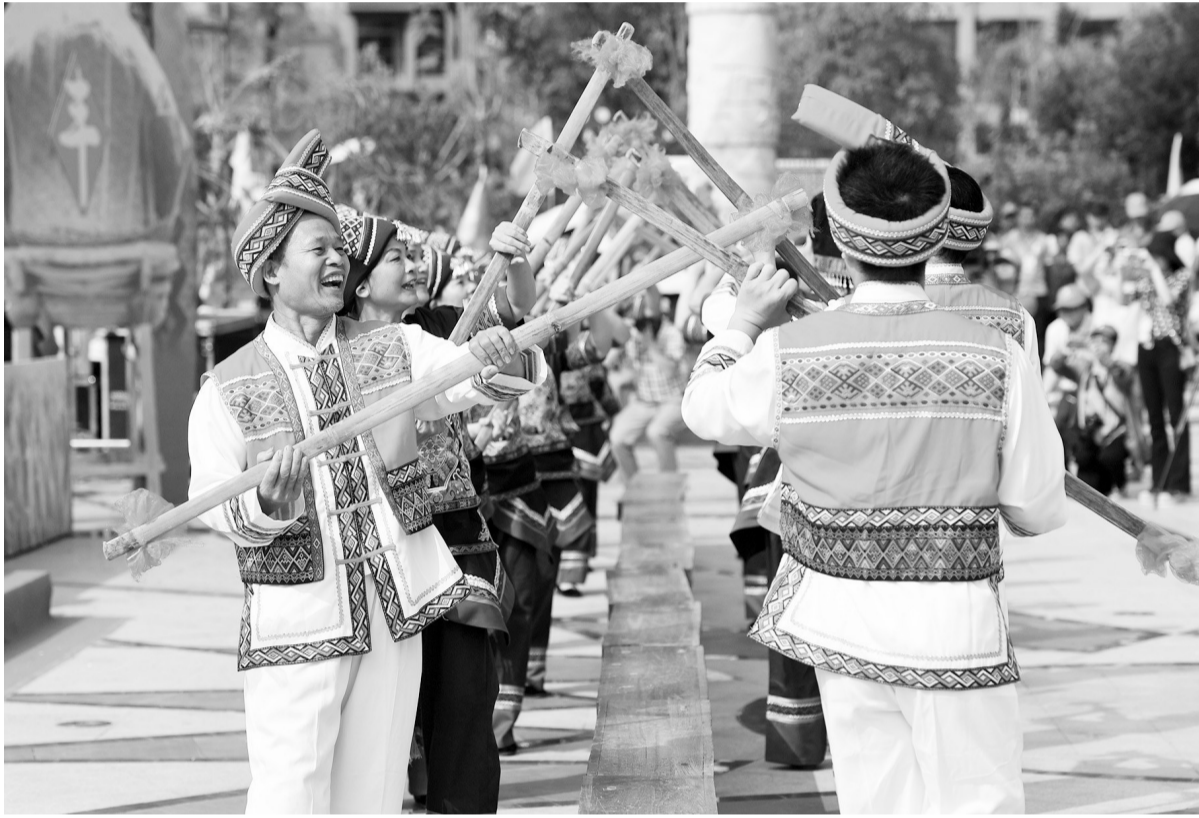
9月17日,广西都安瑶族自治县密洛陀文化公园广场,演员在启动仪式上表演壮族扁担舞。当日,2019年广西庆祝“中国农民丰收节”启动仪式暨河池市“庆丰收·促脱贫”系列活动在都安瑶族自治县举行,各族群众和来宾一起载歌载舞欢庆丰收节。