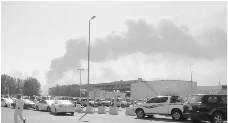
这张沙特的阿拉伯卫视台9月14日的视频截图显示,位于沙特布盖格的沙特国家石油公司(阿美石油公司)石油设施当天起火后冒出浓烟。

核心提示 沙特阿拉伯两处石油设施14日遭无人机袭击引发美国 和伊朗之间的“口水战”。针对美方有关伊朗参与了这起袭击的指责，伊朗方面15日明确予以否认，并对美国发出军事警告。分析人士认为，此次袭击使美国总统特朗普与伊朗总统鲁哈尼可能在9月下旬联合国大会期间举行的会晤蒙上阴影，将加剧海湾地区紧张局势。