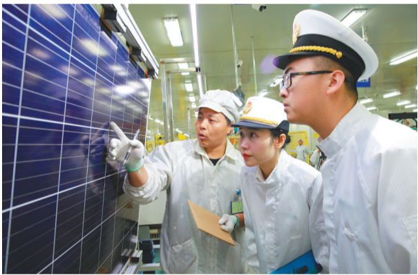
沈阳海关关员上门进行查验。