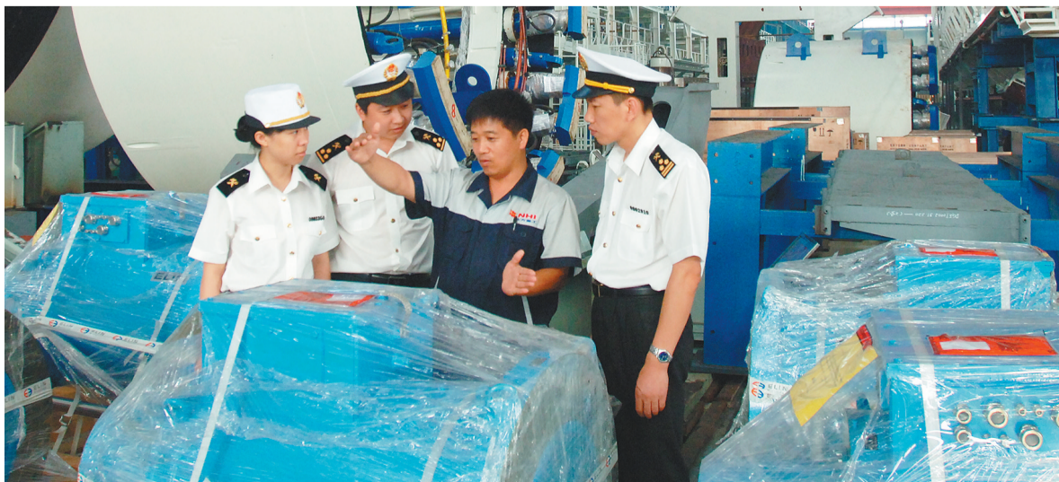
沈阳海关关员实地了解企业生产情况。