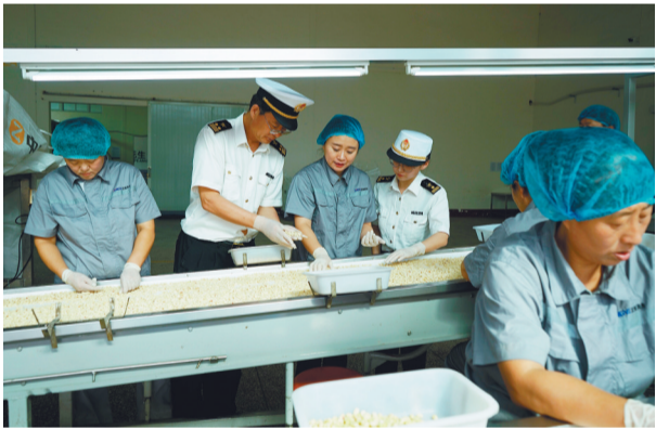
沈阳海关关员深入企业一线了解实际情况。