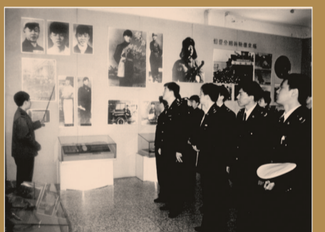
20世纪80年代,关员参观雷锋纪念馆。