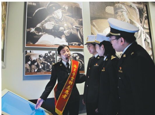
沈阳海关关员(左)在雷锋纪念馆进行义务讲解。