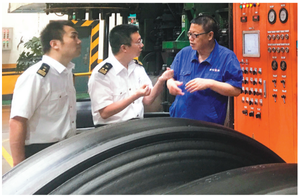
沈阳海关关员向企业负责人了解进出口情况。