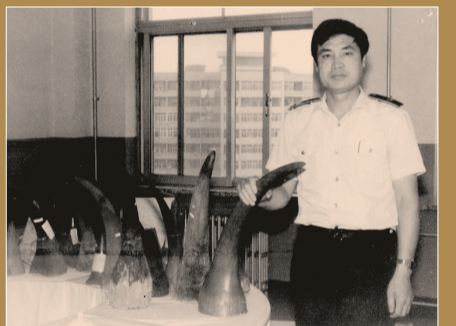
20世纪80年代,沈阳海关查获大量走私物品。