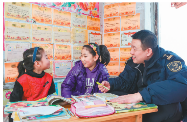
沈阳海关驻村扶贫工作队员为桓仁县雅河乡孩子辅导功课。