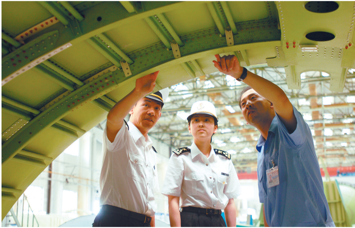
沈阳海关关员现场了解企业发展情况。