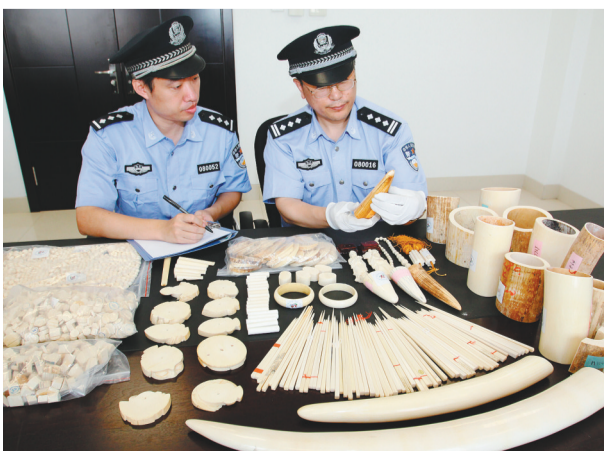
沈阳海关警员对查获的象牙制品进行整理记录。