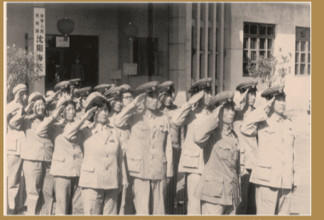
20世纪80年代,沈阳海关举行升旗仪式。