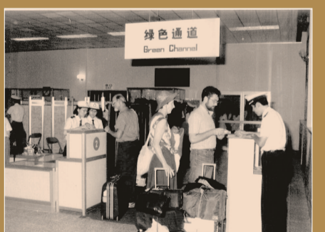
20世纪90年代,沈阳海关驻机场办事处。