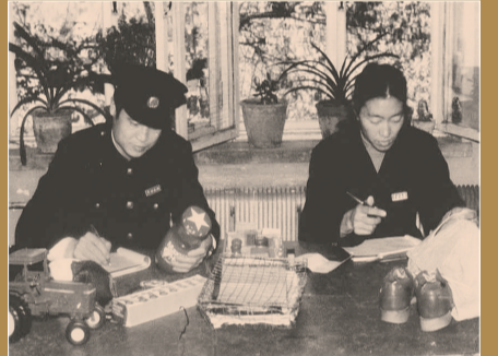
20世纪80年代,沈阳海关驻邮局办事处。