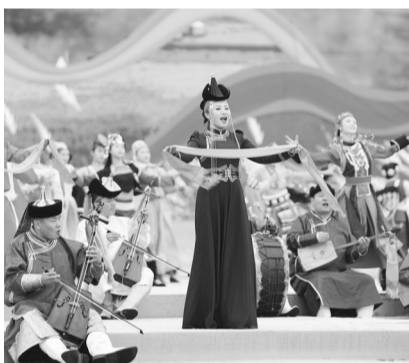
9月12日,第十一届全国少数民族传统体育运动会民族大联欢活动在郑州举行。本组图片均为演员在民族大联欢活动中表演。