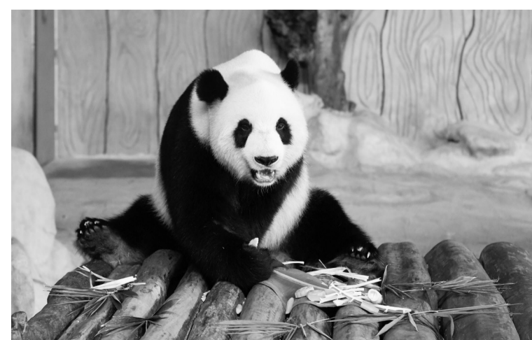
9月12日,大熊猫“贡贡”在享用月饼。中秋佳节将至,海南热带野生动植物园的工作人员为园区内的大熊猫“贡贡”和“舜舜”特别制作了月饼,让大熊猫和游客一起过节。新华社记者 杨冠宇 摄