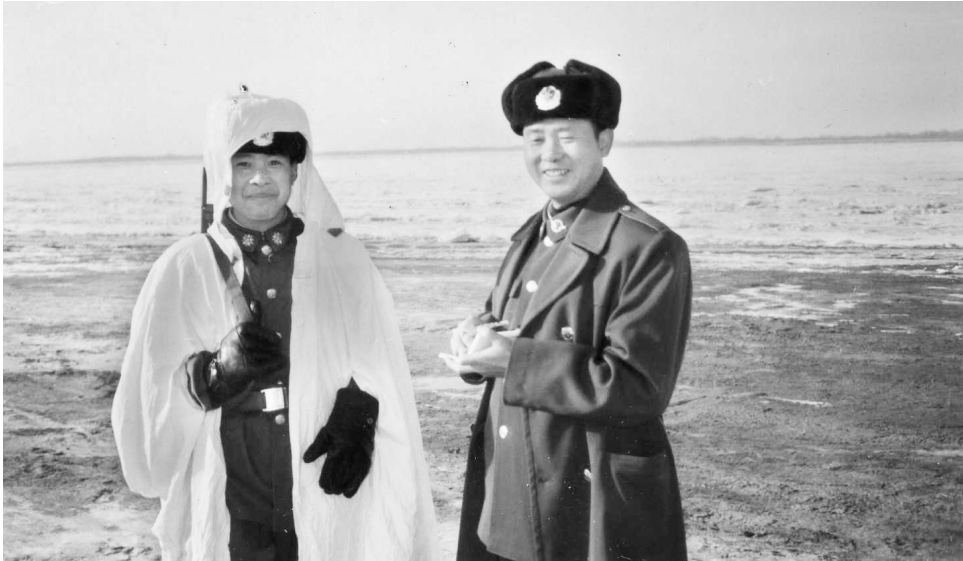
1986 年，胡世宗下基层与边防战士交谈。

我国领土的最东点，也是我国大陆最先迎进日出的地方。每天早上，一面鲜艳的五星红旗会在这里与太阳同步升起，这就是位于黑龙江抚远市乌苏镇中俄边境的“东方第一哨”——乌苏镇哨所。在这个哨所里，与“英雄的东方第一哨”纪念碑同样引人注目的，还有一座金色的浮雕，浮雕的主题来自一首传唱了近 30 年的歌曲——《我把太阳迎进祖国》。 著名军旅作家、诗人胡世宗一生作品无数，只有 145 字的诗作《我把太阳迎进祖国》是他最为大众所熟知的作品，也始终在他的心中占据着特殊的位置，他说：“我在几十年前倾心倾力也是情不自禁写下的‘我把太阳迎进祖国’的诗句，插上了音乐的翅膀，成为了战友们发自内心的感慨和经久不息的对新中国的宣誓。我很荣幸成为了他们的代言人！”