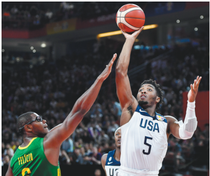
9月9日，美国队球员米切尔(右)在比赛中面对巴西队球员费利西奥的防守投篮。

这样，本届男篮世界杯1/4决赛对阵形势已经全部产生，上半区：阿根廷VS塞尔维亚、美国VS法国，下半区：西班牙VS波兰、澳大利亚VS捷克。根据赛程，1/4决赛将在9月10日和9月11日进行。