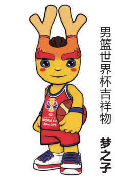
男篮世界杯吉祥物 梦之队