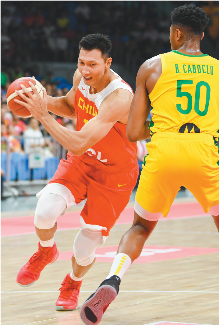
易建联(左)将担任中国男篮队长。

对此,李楠在热身赛中反复检验小个阵容,甚至排出过“死亡五小”。但不可否认的一点是,中国男篮对内线球员非常依赖。3名中锋都具备在