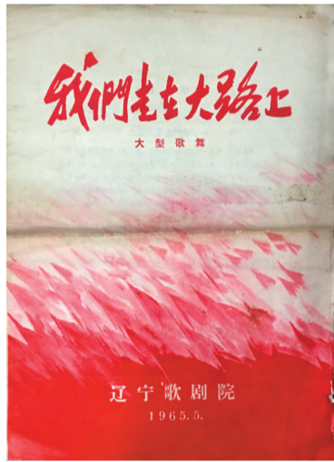
赵怀力珍藏的节目单。

1913年，李劫夫生于吉林省农安县。1937年5月，李劫夫来到延安，在延安人民剧社任教。8月，成为八路军西北战地文艺服务团、冀东军区文工团团员，东北野战军第九纵队文工团团长。1938年9月，李劫夫加入中国共产党。同年，丁玲主编的《战地歌声》一书中收录29首歌曲，其中13首为李劫夫所作。1948年后，李劫夫任东北鲁艺音乐部部长，东北音乐专科学校校长，沈阳音乐学院教授、院长。