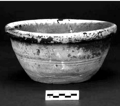
绿釉陶盆

的龙头,口尾相衔,略带霸气;颤巍巍的鎏金银花簪,簪头摇曳着银莲花、银荷叶、银桃心,还镶嵌一颗彩色宝石拟作莲蓬。 付永平说,“进入盛夏,一阵暴雨,墓穴就灌满了,大太阳再一晒,那些金耳环、银戒指等各种各样的陪葬品,就散落在骨骼之间,镶嵌在龟裂的泥壳之中,拨开尘封其上的泥土,