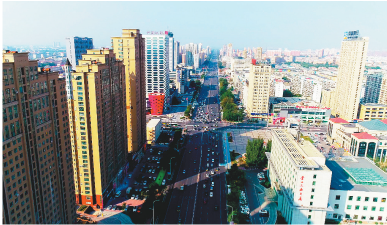
站前区以现代服务业集聚提升城区经济“容积率”。

新经济不断为楼宇赋能,(东北)腾讯企点产业中心、阿里巴巴营口产业带、全球货源平台等百余个企业稳健运行,电商、人力资源、服务外包、结算中心、人工智能等新兴产业加速聚集,站前区楼宇经济将呈现新的生态。