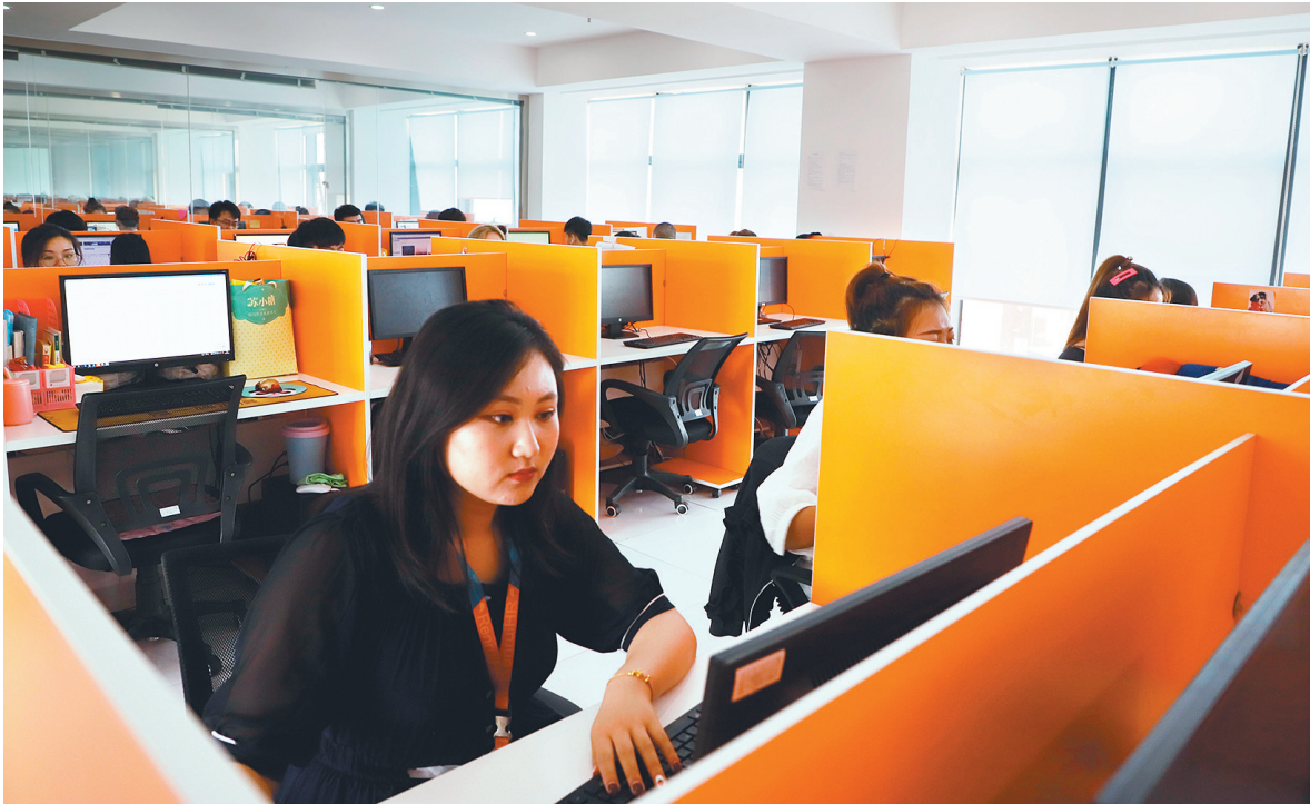
服务外包产业园内的写字间一角。