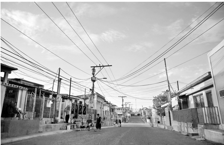
这是7月22日在委内瑞拉马拉开波拍摄的密布的电线路。

法新社报道,加拉加斯停电后,地铁停运、交通信号灯“罢工”,城市交通陷入瘫痪,市民步行出行。信用卡和借记卡因为断电而