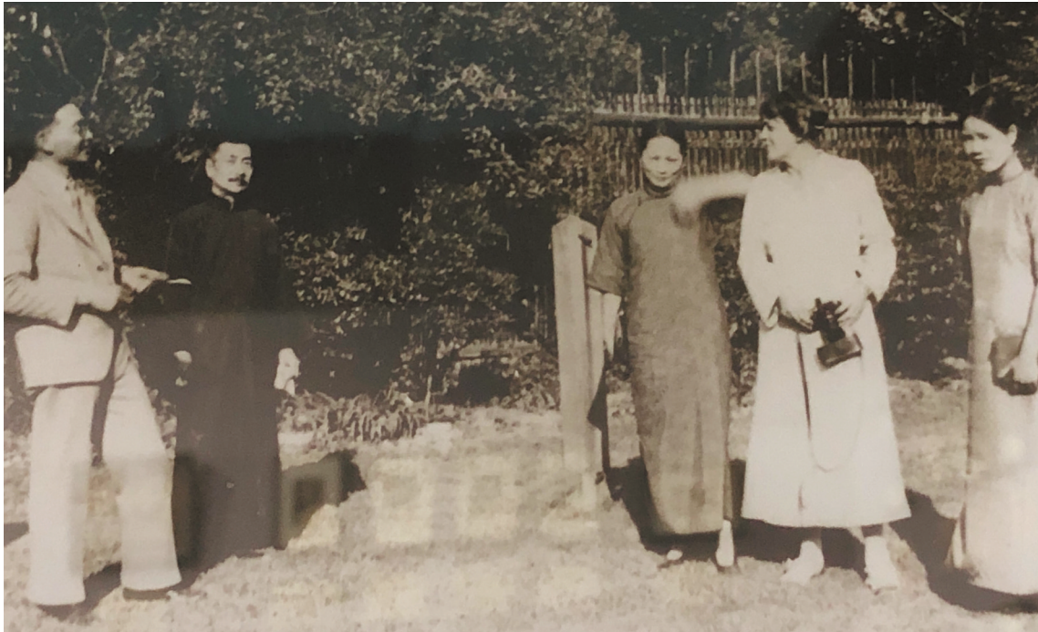
1933年,鲁迅(左二)与宋庆龄(左三)、史沫特莱(左四)、林语堂(左一)、黎沛华(左五)等合影。