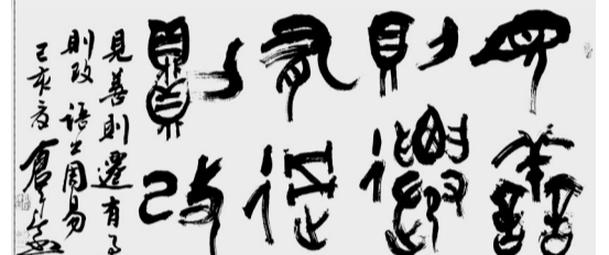
篆书 见善则迁 有过则改 梁传益