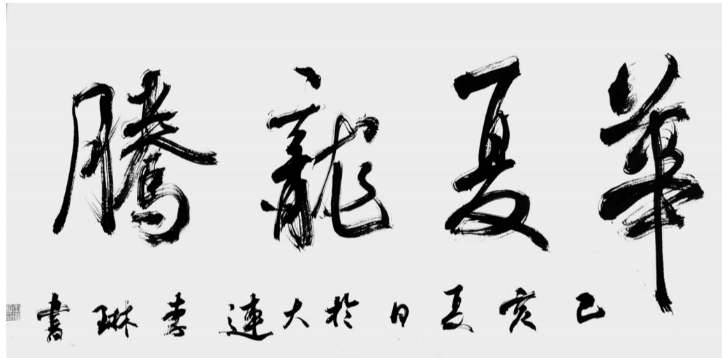
行书 华夏龙腾 李琳

截至目前,全省共举办9场大型活动,近万名书法家、书法爱好者参与创作,推出作品万余幅,共享祖国荣光,感受生活美好,以笔墨奏响礼赞新中国、奋进新时代的昂扬旋律。