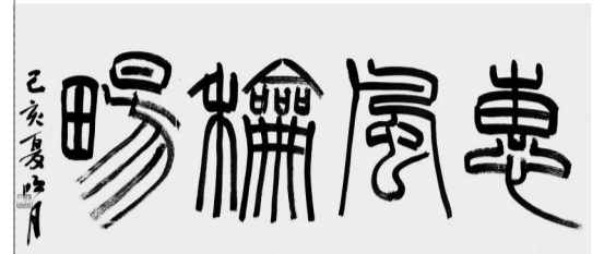
篆书 惠风和畅 朱明月