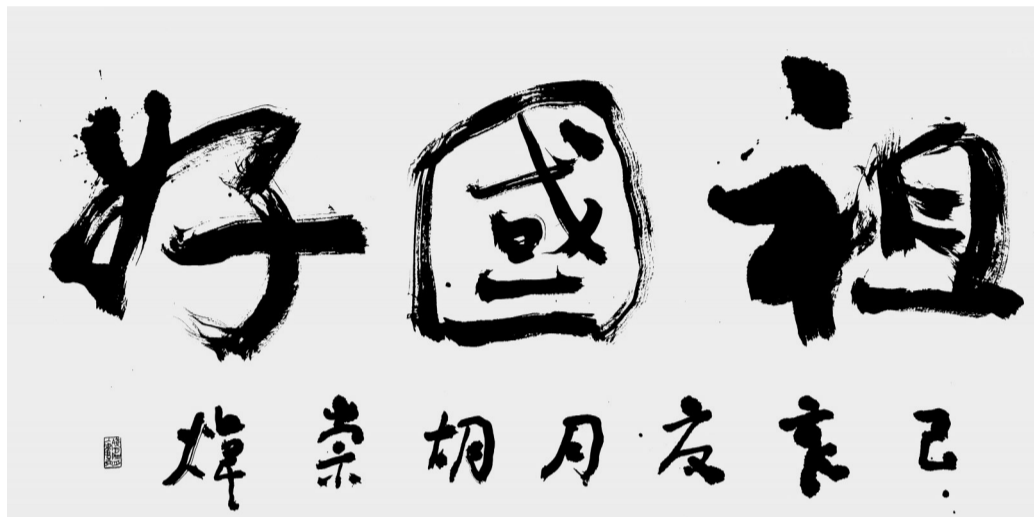
行书 祖国好 胡崇炜

“庆祝新中国成立70周年是党和国家政治生活中的大事,也是我们广大文艺工作者、广大教师和学生生活中的喜事。翰墨飞扬、以笔代歌,是广大书法家、书法爱好者特有的表达方式。全体书写者铺开百米长卷,意在笔先,共同写下经典名句,以精心创作献礼新中国七十华诞。”辽宁省书协副主席、秘书长李琳在主持语中表达了全体书法家的心声。