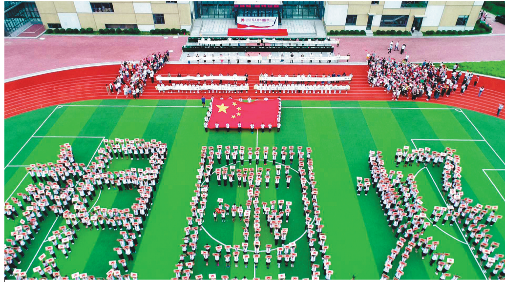
20余位书法名家、1000余名书法教师、1000余名小学生在《我和我的祖国》优美动人的歌声中,在蓝天白云的映衬下共书祖国好书法长卷,庆祝新中国七十华诞。

此次活动由辽宁省文学艺术界联合会主办,辽宁省书法家协会、大连市书法家协会承办,大连市甘井子区教育局、大连市甘井子区文化事业服务中心协办。