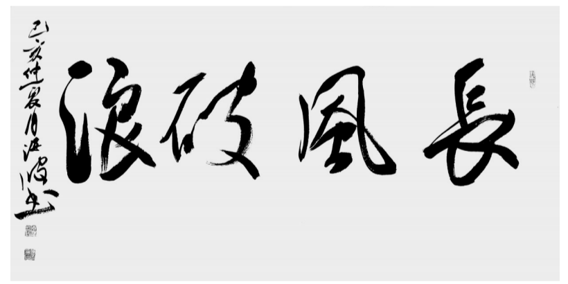
行书 长风破浪 阎海波