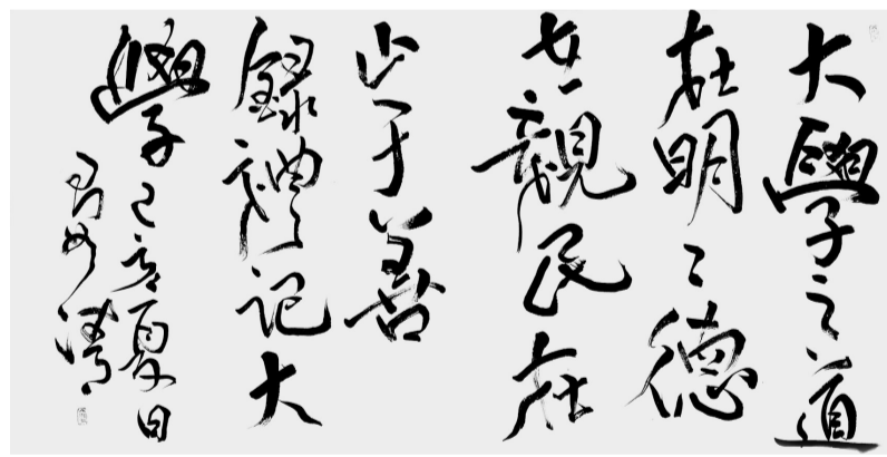
草书 大学之道 在明明德 在亲民 在止于(至)善 李宴清