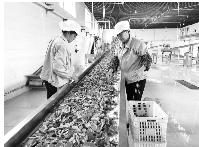
晟昱农业的工人进行原料筛选。