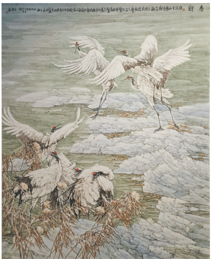
胡泽涛 中国画《春潮》