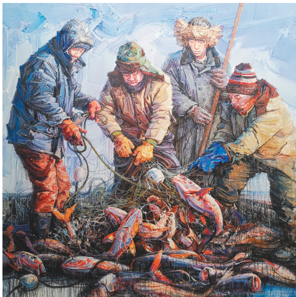
张阳 油画《卧龙湖 冬》