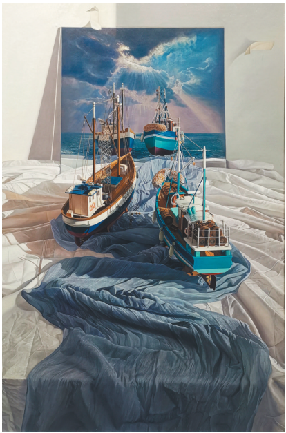
赵岩 油画《追梦 启航》