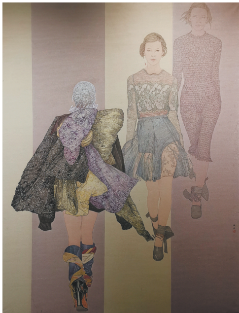
佟佳原 中国画《青春 印象》