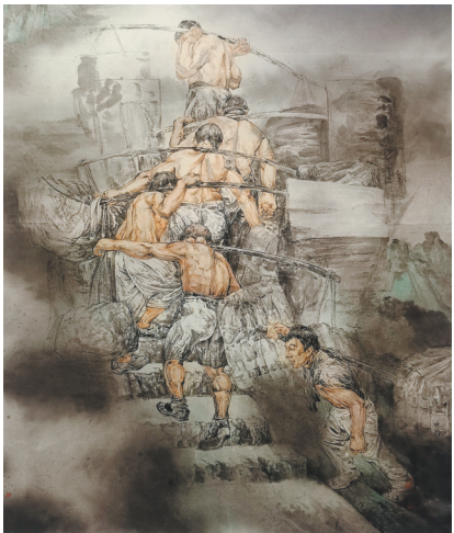
朱永明 中国画《律动的山脊》