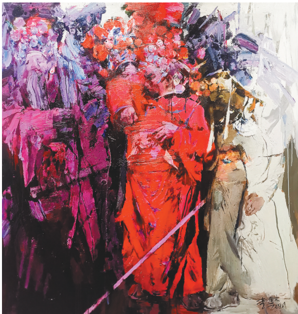
李连文 油画《八里甸子社火》