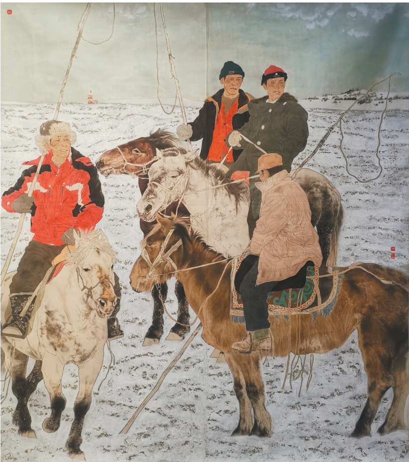
丁元 中国画《铁勒遣风》