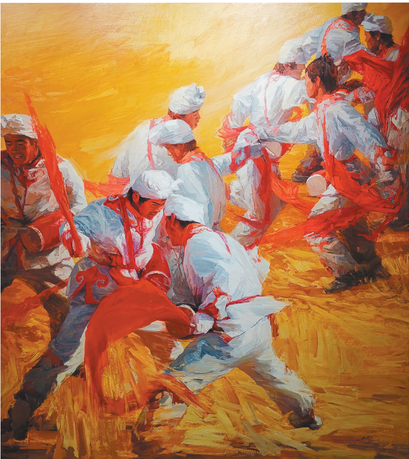
丛艺 油画《时代的和音》