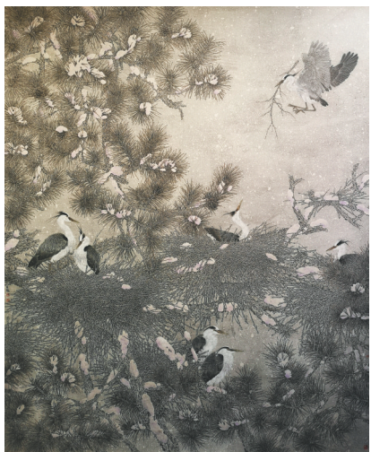
谭昌龙 中国画《雪落家园自悠然》