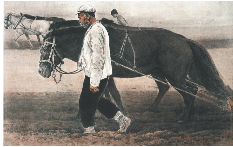
中国画《耕者》1984年创作

文艺是时代前进的号角,最能代表一个时代的风貌,最能引领一个时代的风气。当下,中国特色社会主义进入新时代,中国美术事业迎来无限广阔、更加绚丽的发展前景。在中国美术多元化发展的趋势下,王盛烈所代表的以真善美为精神旨归的现实主义必将生发出新的生命活力。我们珍视王盛烈贡献于鲁美的这份宝贵艺术遗产,以鲁艺精神为指引,坚持与时代同步伐,坚持以人民为中心,坚持以精品奉献人民,坚持用明德引领风尚。以艺术培根铸魂,滋养人心;以描绘时代风云、塑造时代典型、弘扬时代精神的美术创作凝聚家国意识,彰显人文情怀,担负文化使命,推动中国美术事业一步步迈向艺术“高峰”。