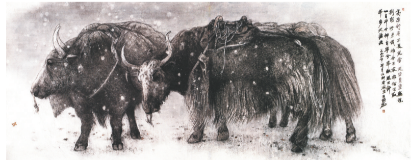
中国画《高原行者》1999年创作