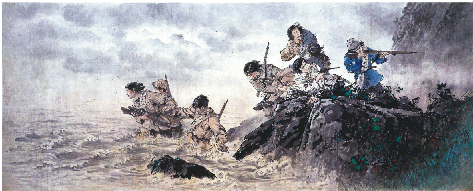
中国画《八女投江》1957年创作 中国人民革命军事博物馆藏(国家一级文物)

鲁迅美术学院始终坚守鲁艺精神的传承,“艺术为人民”的思想深深扎根于鲁美艺术教育创作之中。正因为此,造就了当代现实主义中国画大师、著名美术教育家——王盛烈。