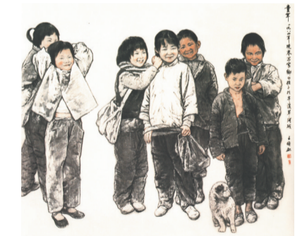
中国画《家乡的孩子》1984年创作 中国美术馆藏

王盛烈1923年出生于沈阳,18岁到日本留学,21岁回到祖国。1946年在北京中山公园举办画展,与徐悲鸿相识。1949年,26岁的王盛烈转入东北鲁迅艺术学院美术部任讲师。1958年任鲁迅美术学院中国画系第一副主任,1976年恢复工作,1980年任中国画系主任。1979年当选为中国美术家协会理事。1982年被推选为辽宁中国画研究会会长。1980年任鲁迅美术学院副院长,主管教学工作,兼任中国画系主任,1983年任鲁迅美术学院副院长,主持学院工作,至1986年离休。1985年,被推选为中国美术家协会常务理事。1998年,获“鲁迅美术学院荣誉终身教授”称号,2003年病逝,享年80岁。王盛烈在鲁艺执教五十余载,将自己的全部生命情感和艺术才华都奉献给了新中国的美术教育事业。