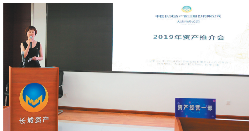
中国长城资产大连市分公司召开资产推介会。

本报讯 6月28日,中国长城资产管理股份有限公司大连市分公司2019年首次资产推介会在大连行政服务中心举行,金融同业、中介机构及投资者共200余人参加,推介会通过阿里拍卖进行了网络同步直播。 中国长城资产管理股份有限公司注册资本512.3亿元,由中华人民共和国财政部、全国社会保障基金理事会和中国人寿保险(集团)公司共同发起设立。中国长城资产管理股份有限公司大连市分公司,前身为中国长城资产管理公司大连办事处,成立于2000年2月26日。大连市分公司坚持以收购管理和处置不良资产为己任,切实履行中央金融企业的社会责任,为化解金融风险、支持实体经济起到了积极的推动作用,获得了政府和上级机构的充分肯定。 本次推介会共推出217项债权及