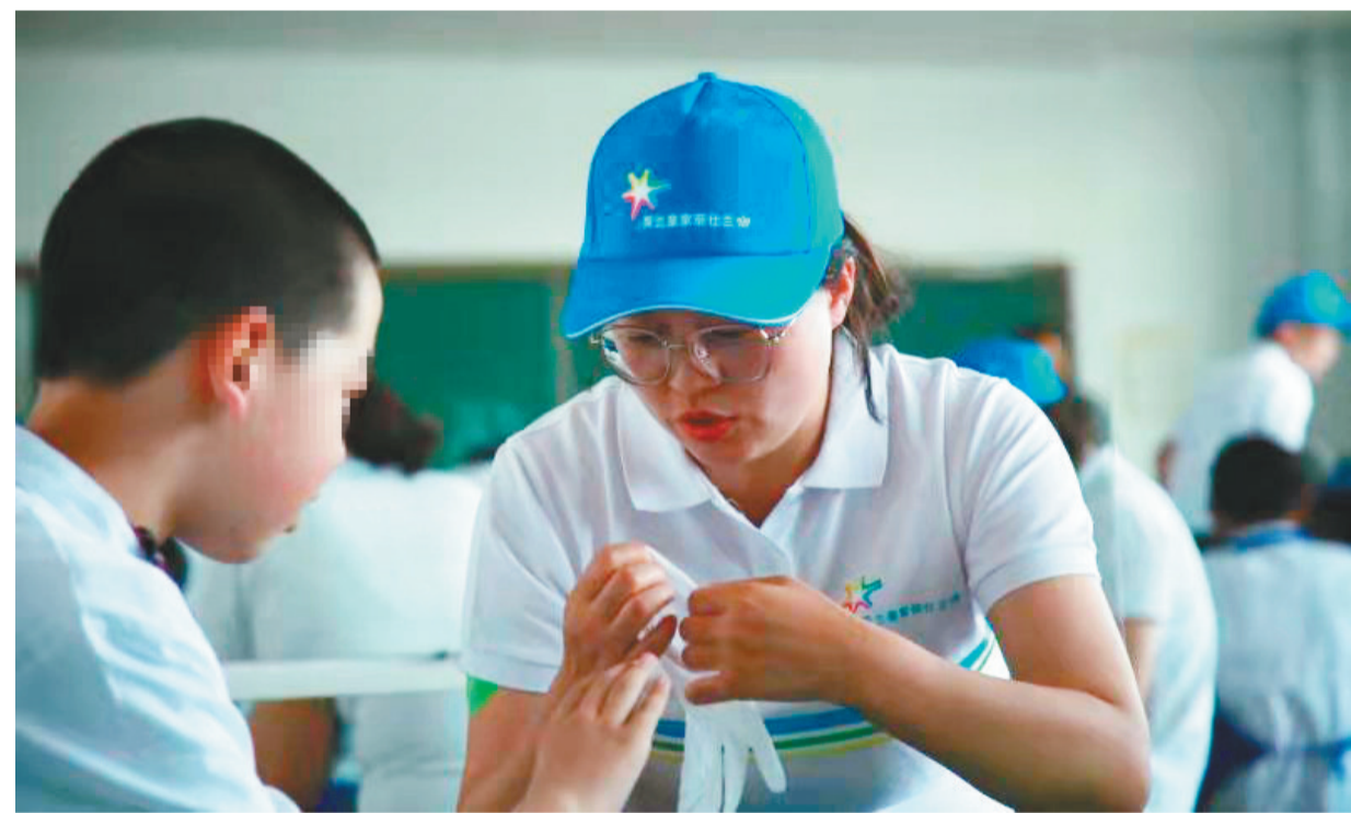
菲仕兰员工志愿者走进法库县爱心学校开展志愿服务。