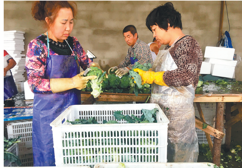
村民们在整理刚刚收割的西蓝花。

看着工人们开心忙碌的身影,看着一车车整齐的西蓝花发往省外,胡志家夫妇沉浸在丰收的喜悦中。