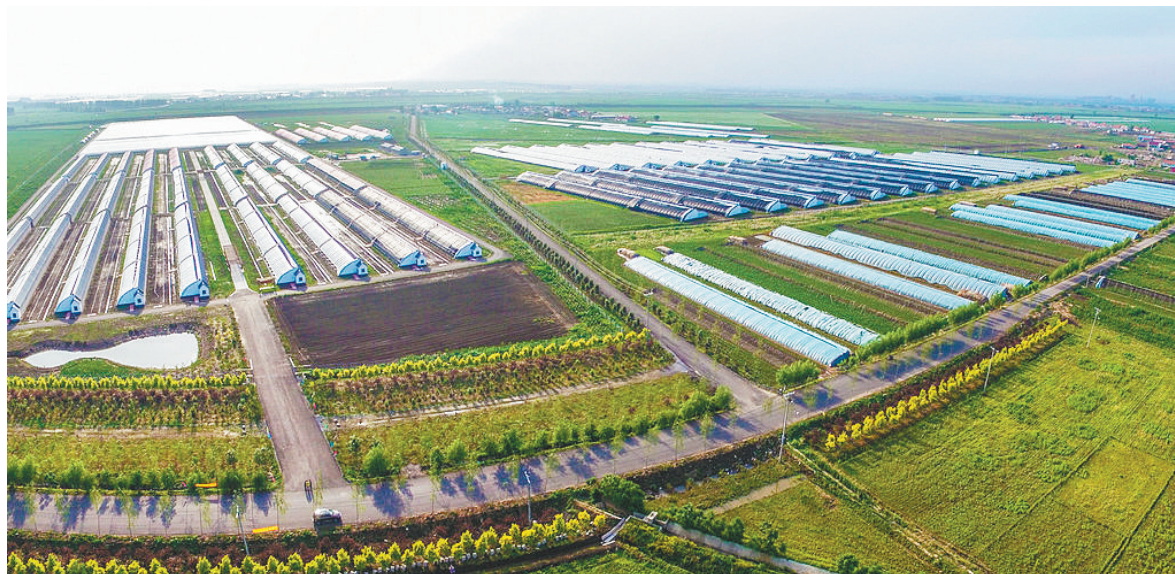
俯瞰灯塔辽峰小镇,村美民富,日新月异。

经过3年的努力,灯塔市累计投入近8000万元,落实省级扶持壮大村级集体经济项目村21个,落实市本级壮大村级集体经济项目村49个;新增固定资产3000余万元,增加村级集体经济收入约410万元,1/3以上经济薄弱村的问题得到解决。