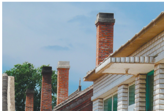
跨海式烟囱的满语名称是“呼兰”。