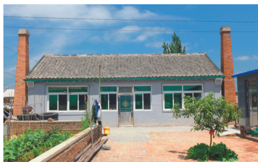
小莲花村家家户户都有跨海式烟囱。