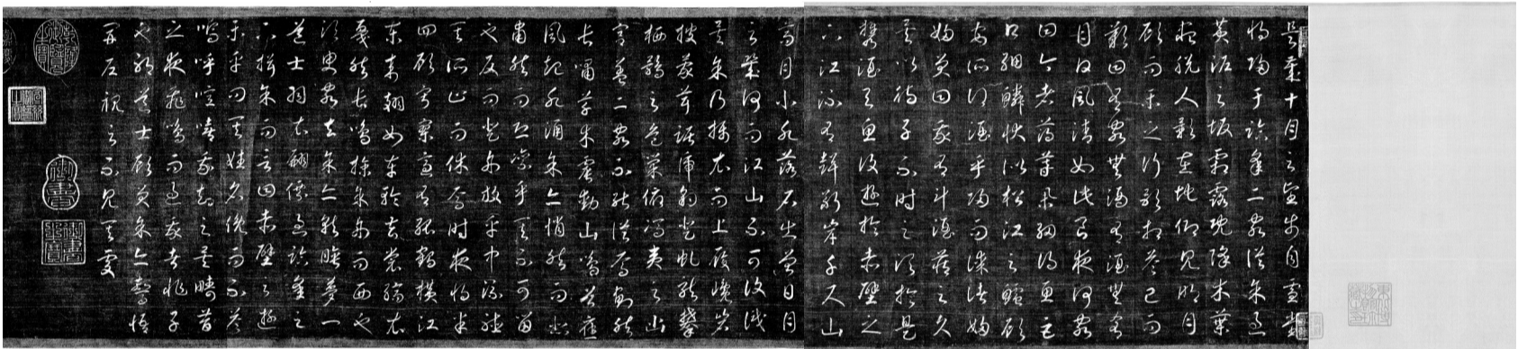
上图为元代和明代文人题写的跋文；下图为金字草书《宋孝宗赵昚草书后赤壁赋卷》全文。