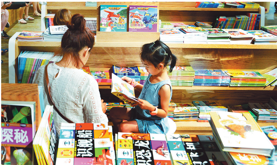
专心阅读的小读者。

谭旭东:在任何时代,通俗的、流行的作品总是占据着阅读的主流,不过,随着时间的淘洗,大众的不断区分选择,一些优秀的能够超越时代趣味的作品就被流传下来,成了跨越时代的经典。当下,不也是大众趣味十足的各种流行文化在大肆占领各种影视频道和报纸杂志吗?不只是青春文学、网络文学中也夹杂着流行趣味,就是纯文学期刊和以纯文学创作为主旨的作品,不也在向大众趣味妥协吗?任何一个时代,都有很热闹的文化景观,但最清醒的人往往是少数,而且能够不为一时的大众趣味而随意改变自己审美取向和精神高度的人,才可能成为时代的文化英雄。所以我觉得,阅读是需要引领的,文化更需要引领,大众的趣味也是可以调试的。我觉得一个有责任、有理想、有追求的作家给大众提供的作品应该不是可以随时随地拿来取乐的,应该是那种让大众跳起来才能摘得到的苹果。