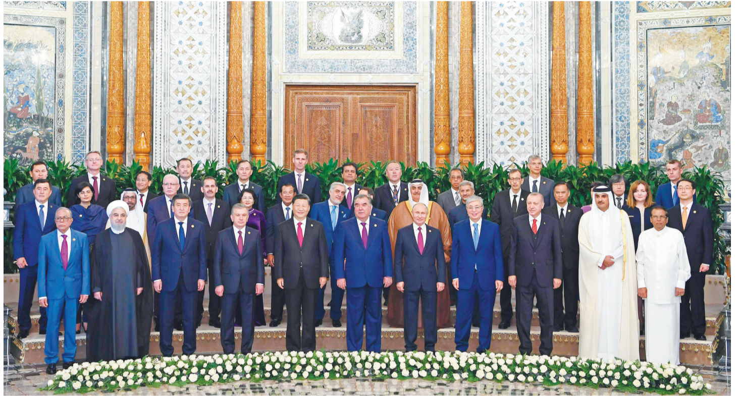
6月15日,亚洲相互协作与信任措施会议第五次峰会在塔吉克斯坦杜尚别举行。国家主席习近平出席峰会并发表重要讲话。这是出席会议的亚信成员国领导人或代表,观察员国代表以及有关国际和地区组织代表集体合影。新华社记者 张 颖 摄

新华社杜尚别6月15日电(记者范伟国 骆璐 郝方甲)亚洲相互协作与信任措施会议第五次峰会15日在塔吉克斯坦首都杜尚别举行。国家主席习近平出席峰会并发表重要讲话,强调要建设互敬互信、安全稳定、发展繁荣、开放包容、合作创新的亚洲。中国将坚定走和平发展道路,坚持开放共赢,坚定践行多边主义,同各方共同创造亚洲和世界的美好未来。 当地时间上午,习近平抵达纳乌鲁兹宫迎宾馆,受到塔吉克斯坦总统拉赫蒙热情迎接。 会议由拉赫蒙主持。阿富汗、阿塞拜疆、孟加拉国、柬