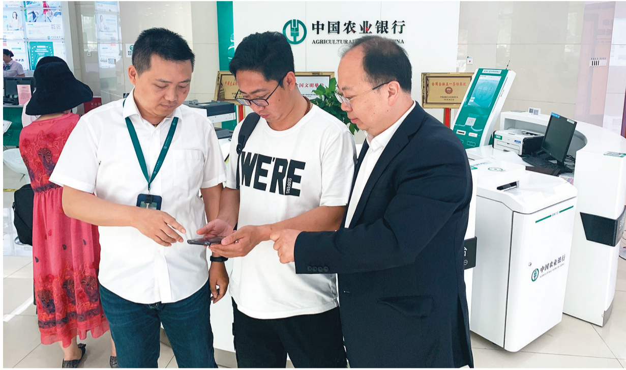
农行辽宁省分行客户经理指导客户通过掌上银行办理个人贷款业务。

捷贷”扩户工程,将产品涵盖的存量房贷模型、代发工资模型、特优单位工资模型、公积金模型、金融资产模型以及分行特色模型六大基础模型全部开通,快速提高白名单客户的基数和质量,目前该产品已覆盖超过130万人。同时,该行多次开展“网捷贷”利率优惠专项营销活动,减轻客户资金使用压力,真正实现让利于民。针对暂时不满足线上产品要求的客户,农行辽宁省分行认真分析客户的资产配置情况,通过“房抵贷”“车位贷”“家装贷”等线下产品进行及时对接,打通线上线下一体化营销渠道,实施线上线下协同获客、线上自动授信审批,系统人工联动管理的消费信贷发展模式,满足客户消费需