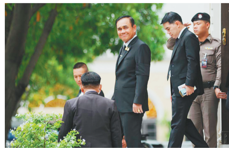
6月6日，在泰国曼谷，泰国总理巴育(中)准备参加政府会议。泰国现任总理巴育5日在新一届国会上下两院第一次常务会议上，当选为泰国新一任总理。