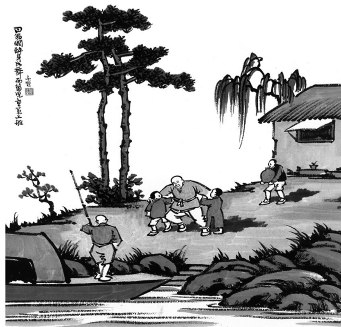
中国网络电视台制 上海丰子恺旧居陈列室供稿