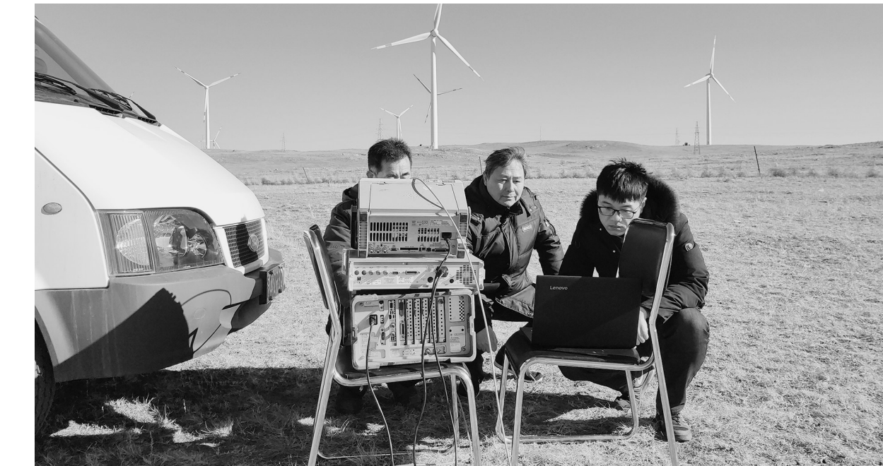
在内蒙古希拉穆仁草原上，中国电科第14研究所某雷达团队在开展电磁环境测试（3月23日摄）。

70年，能做什么？一个人也许庸碌地过完了一生，一群雷达事业的先行者，却硬是把一个只能靠“捡”雷达用的行业，打造成了一张响当当的中国名片。