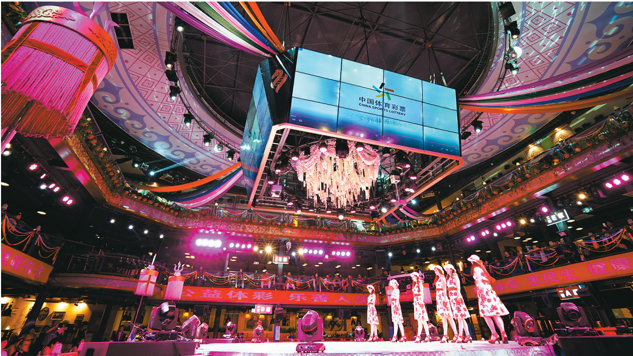
体彩文化节启动仪式上,中老年模特大赛正在进行中。