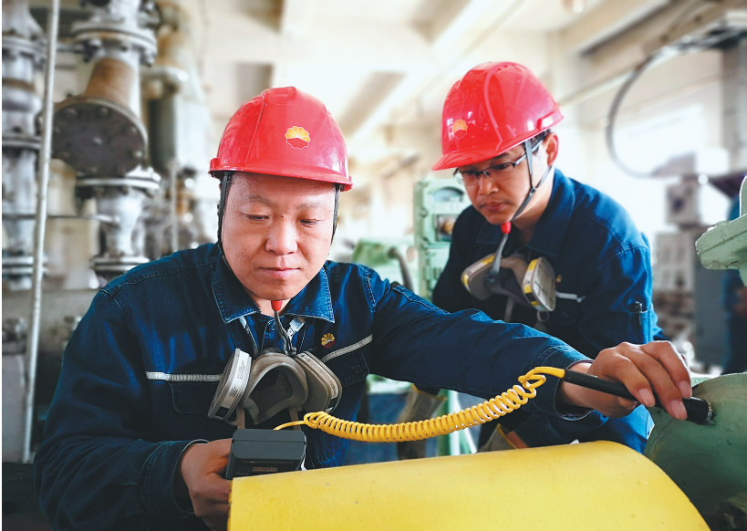
辽阳石化焦化车间员工正在进行安全监测。