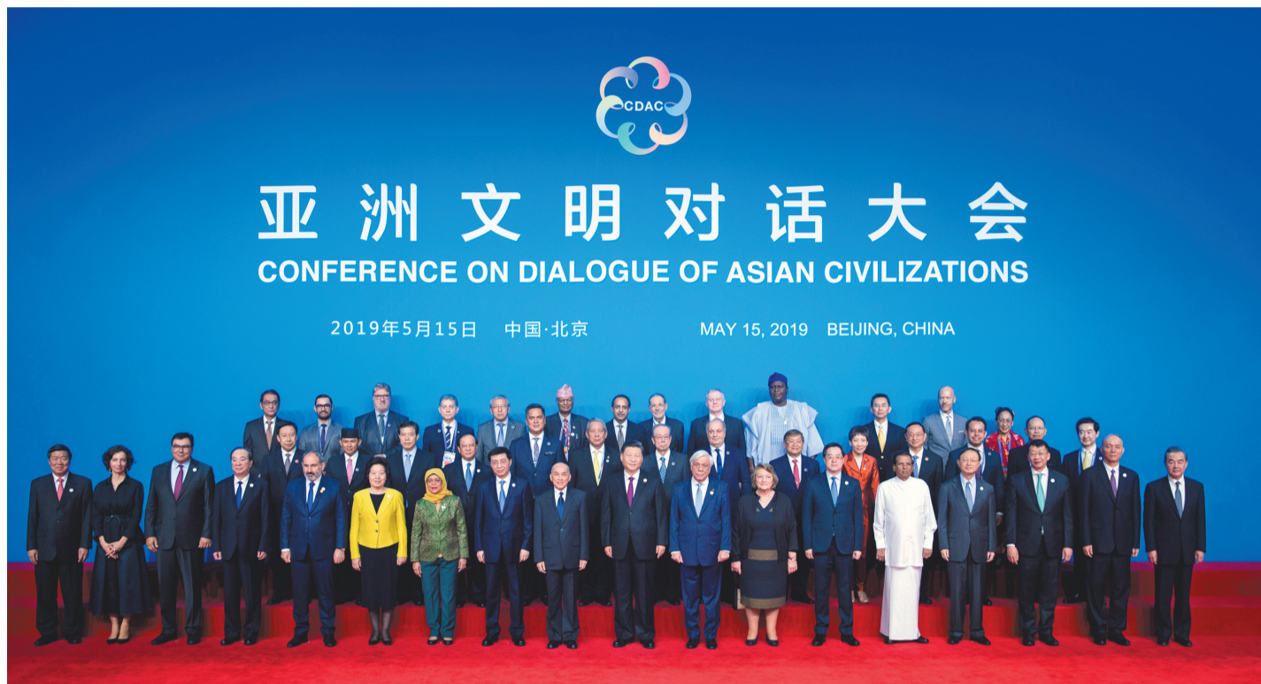
5月15日,国家主席习近平在北京国家会议中心出席亚洲文明对话大会开幕式,并发表题为《深化文明交流互鉴 共建亚洲命运共同体》的主旨演讲。这是开幕式前,中外领导人同出席开幕式的重要嘉宾代表合影留念。

新华社北京5月15日电(记者李忠发 熊争艳 丁小溪)国家主席习近平15日在北京国家会议中心出席亚洲文明对话大会开幕式,并发表题为《深化文明交流互鉴 共建亚洲命运共同体》的主旨演讲,指出璀璨的亚洲文明为世界文明发展史书写了浓墨重彩的篇章。亚洲文明对话大会,为亚洲及世界各国文明开展平等对话、交流互鉴、相互启迪提供了一个新的平台。