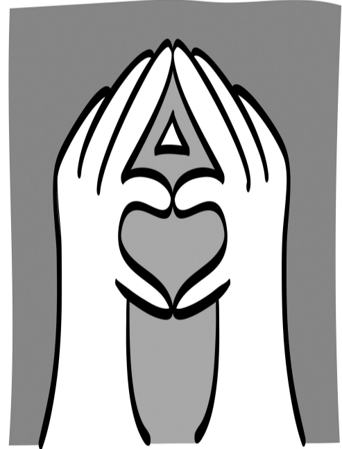
真正的友情,是心灵的交融,是彼此理解和包容。 作者 隋文锋

坚持包容互鉴,促进文明发展繁荣。人类文明多样性赋予世界姹紫嫣红的色彩,多样带来交流,交流孕育融合,融合产生进步。绵延五千多年的中华文明正是在与世界其他文明持续不断的交流互鉴中发展壮大。人类历史本来就是一幅不同文明相互交流、彼此借鉴、和合融通的宏伟画卷。各种文明因包容才有交流互鉴的动力,因交流互鉴才变得更加丰富多彩。海纳百川,有容乃大。任何一种文明,不管它产生于哪个地区、哪个国家、哪个民族的社会土壤之中,都是流动的、开放的,都是在同其他文明的交流交融中演化成今天的形态。对人类文明创造的各种文明,我们都应该采取学习借鉴的态度,都应该积极吸纳其中的有益成分,使人类创造的一切文明中的优秀文化基因与当代文化相适应、与现代社会相协调,把跨越时空、超越国度、富有永恒魅力、具有当代价值的优秀文化精神弘扬起来。这样,人类文明才能充满生命力,不断创造性转化和创新性发展,世界文明之园才能变得更加姹紫嫣红、生机盎然。